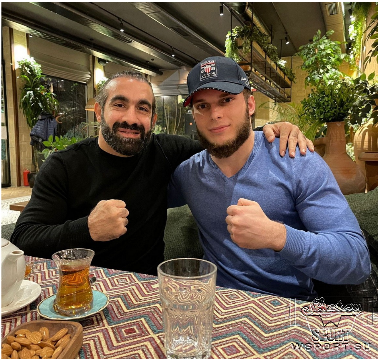
Рафаэль Агаев и Ибрагим Исаев

Рафаэль Махир Оглы Агаев является самым титулованным каратистом в истории этого вида спорта, первым и единственным в мире пятикратным чемпионом планеты, а также единственным каратистом, которому на одном чемпионате мира удалось завоевать две золотые медали. ЗДЕСЬ