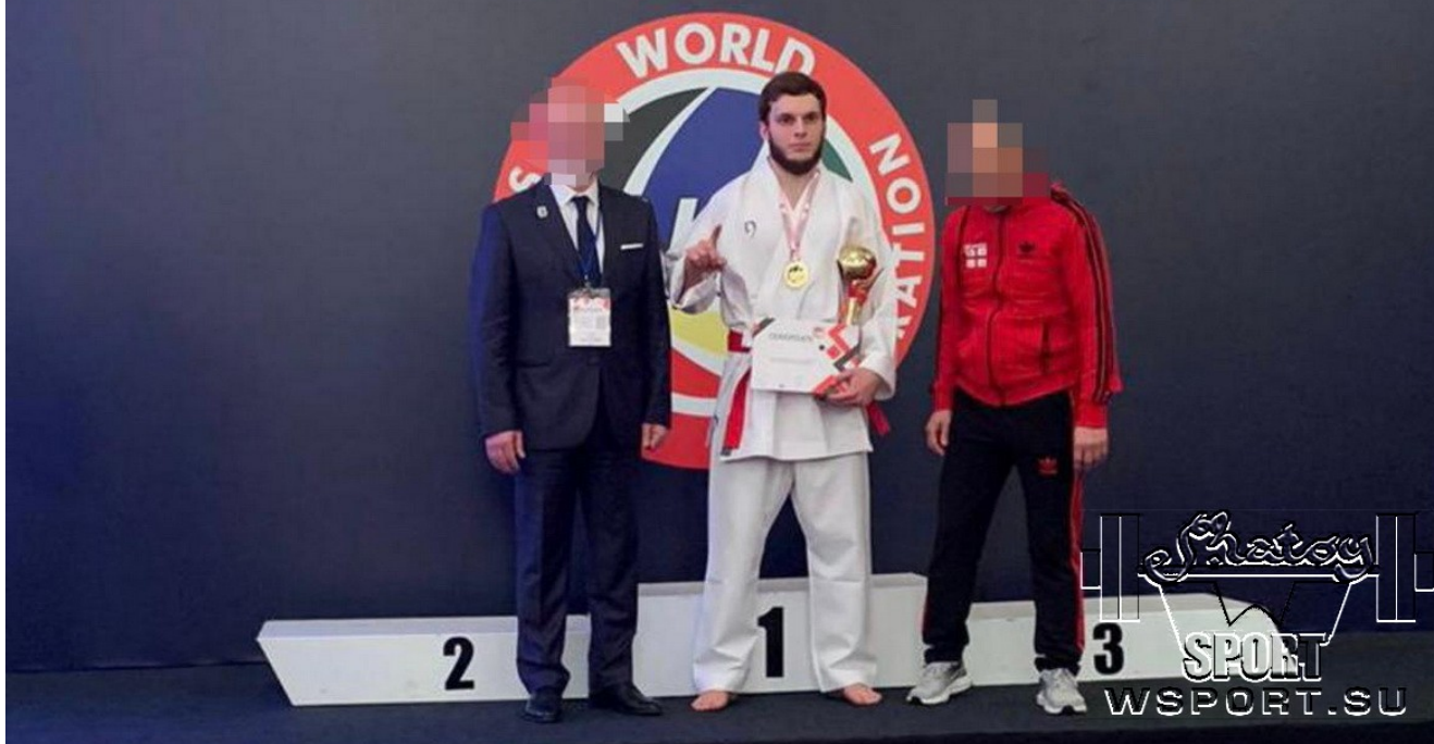
Чемпион мира по карате шотокан Ибрагим Исаев