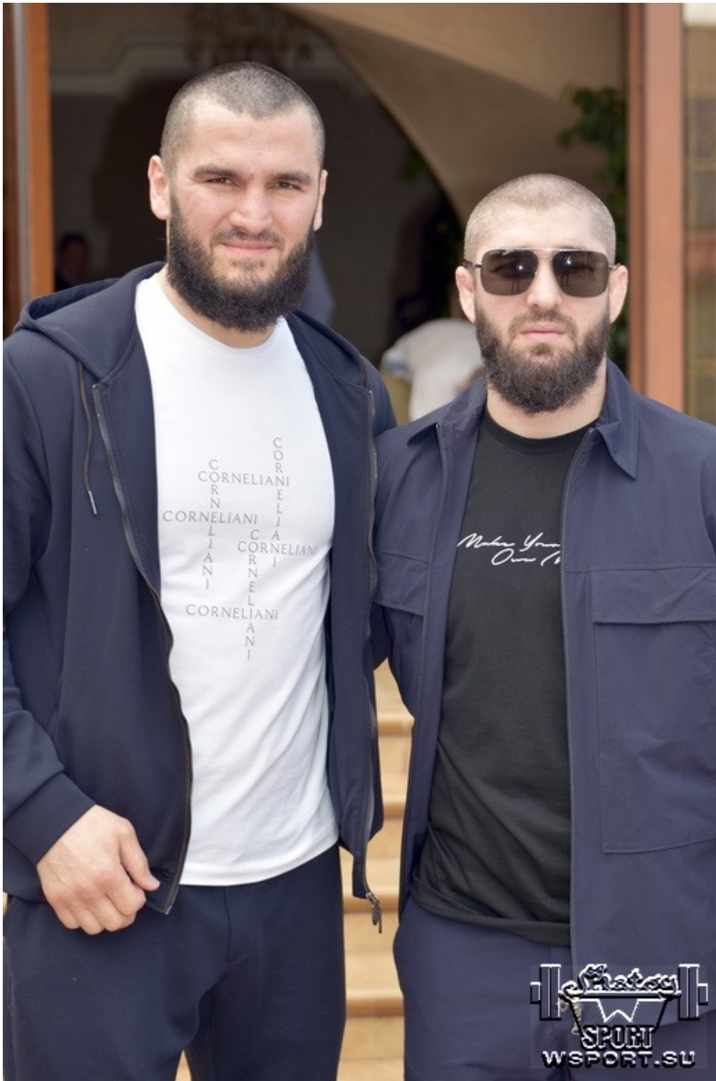
Артур Бетербиев и Чингиз Лабазанов