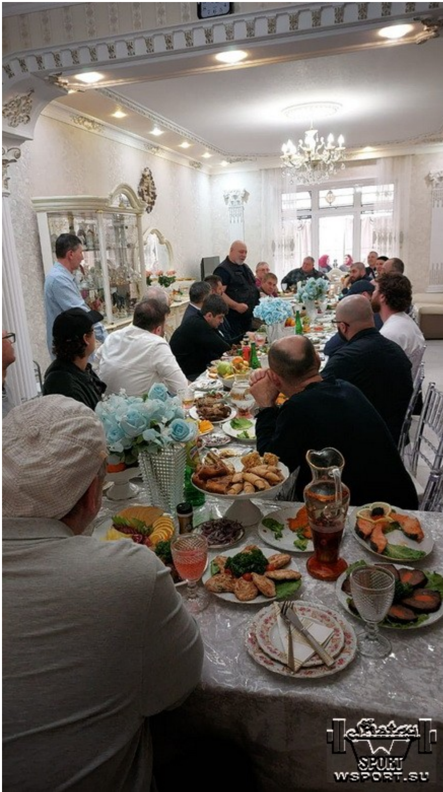
За праздничным столом