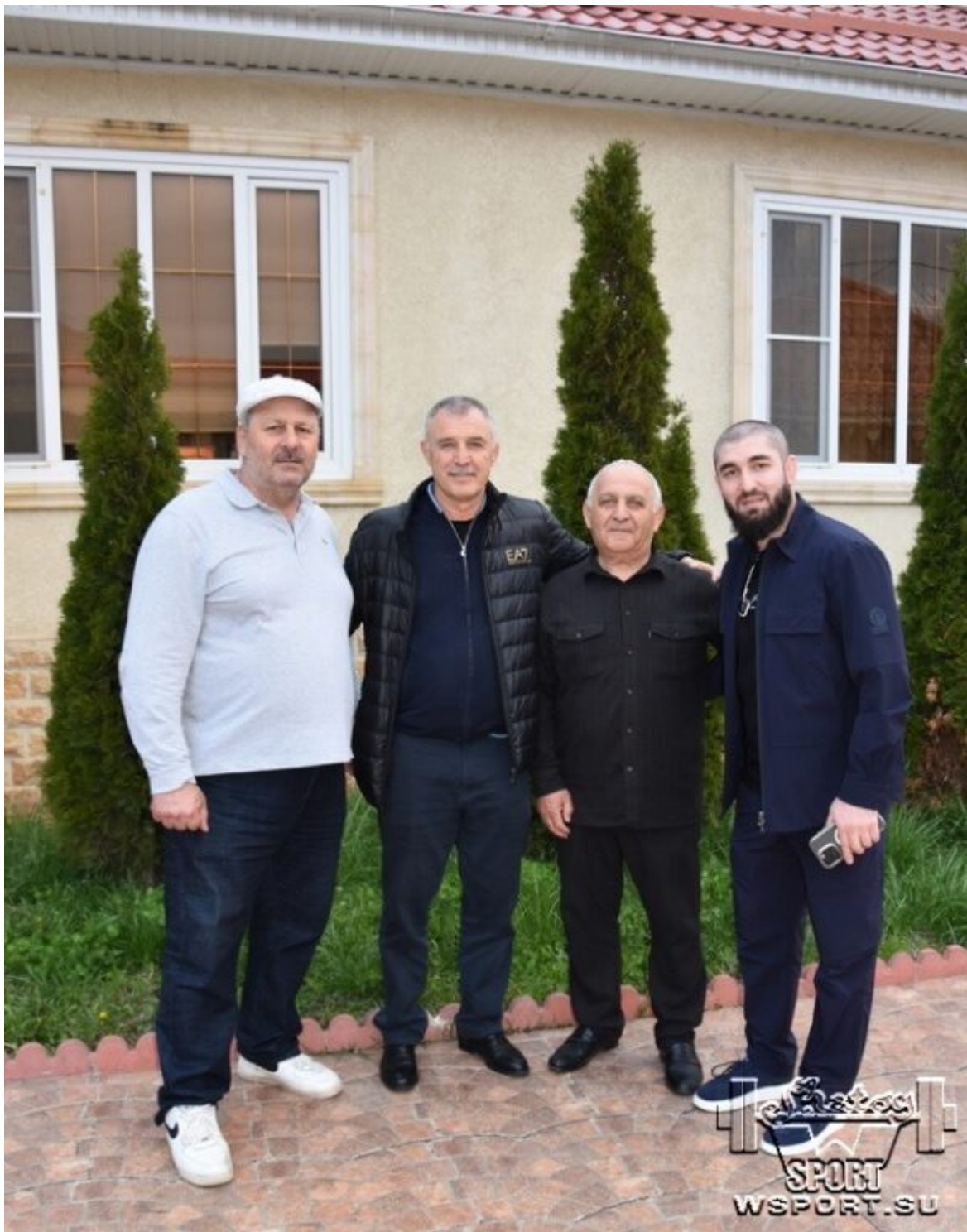
Три самбиста и классик.