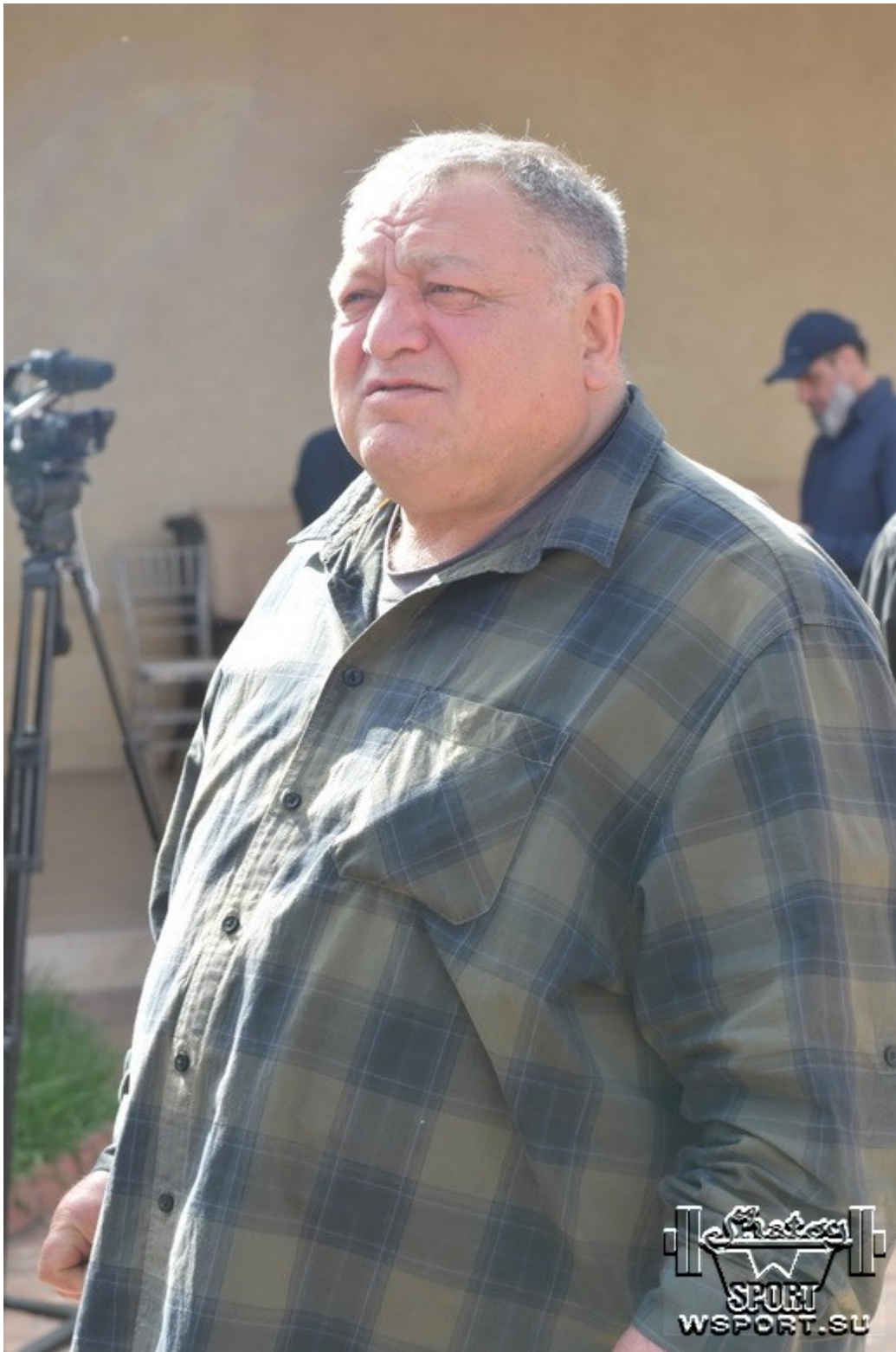
Победитель Олимпийских игр 1988 года по тяжелой атлетике Исраил Арсамаков