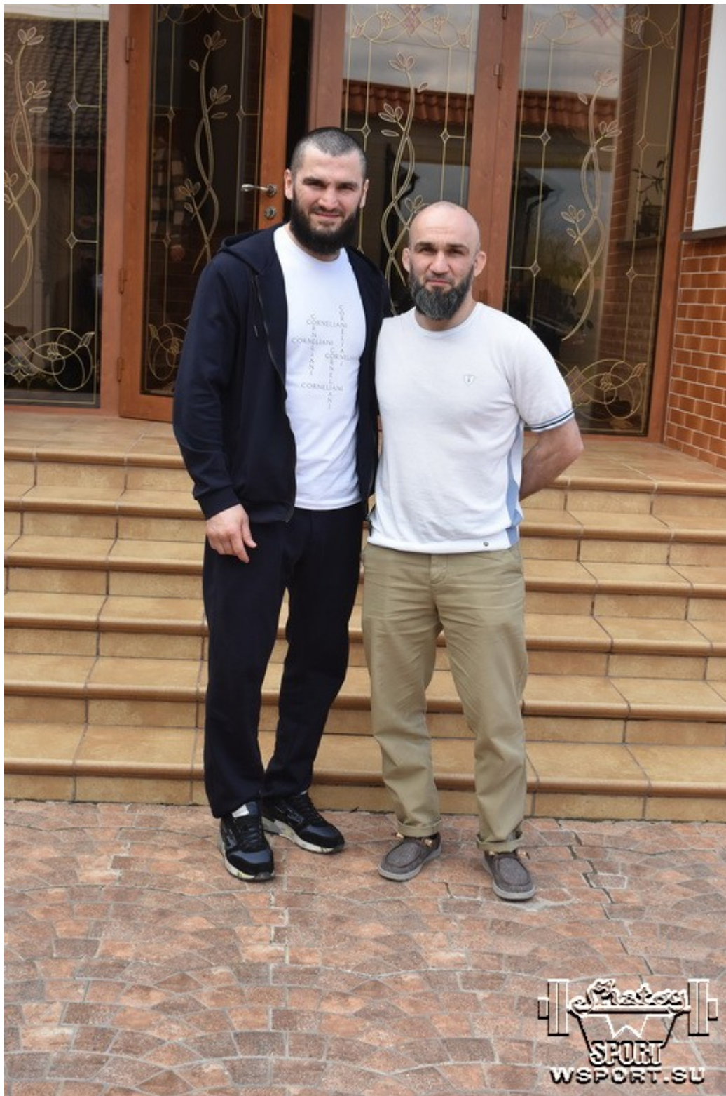
Артур Бетербиев и Расул Джукаев