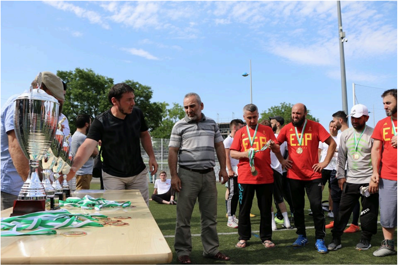
Президент ассоциации "Даймехкан кхерч" награждает финалистов.