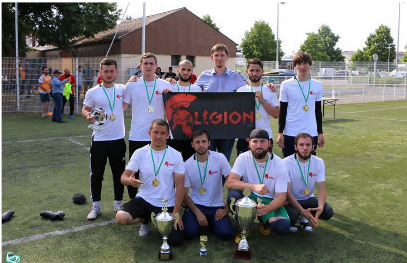
2-кратный победитель Кубка Франции - Мемориала Юсупа Темерханова среди вайнахов Легион - Ницца.