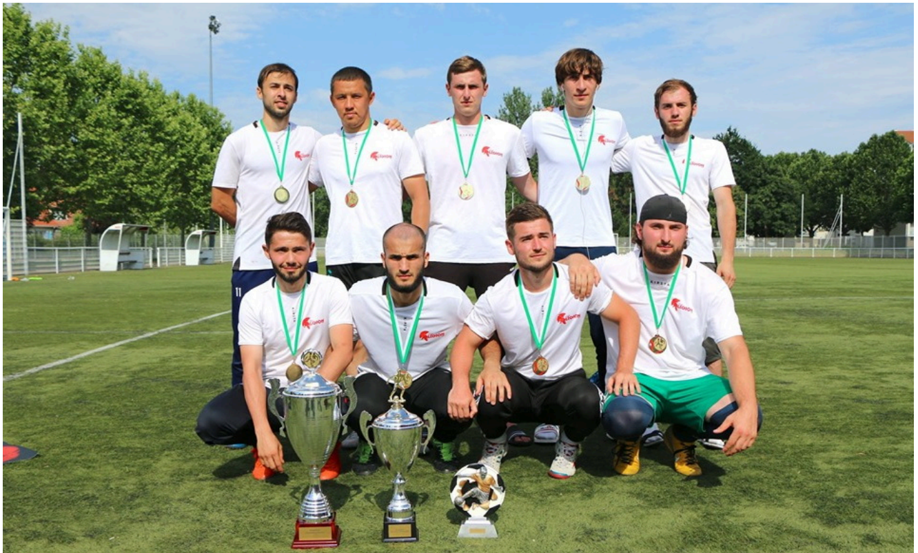
2-кратный победитель Кубка Франции - Мемориала Юсупа Темерханова среди вайнахов Легион - Ницца.