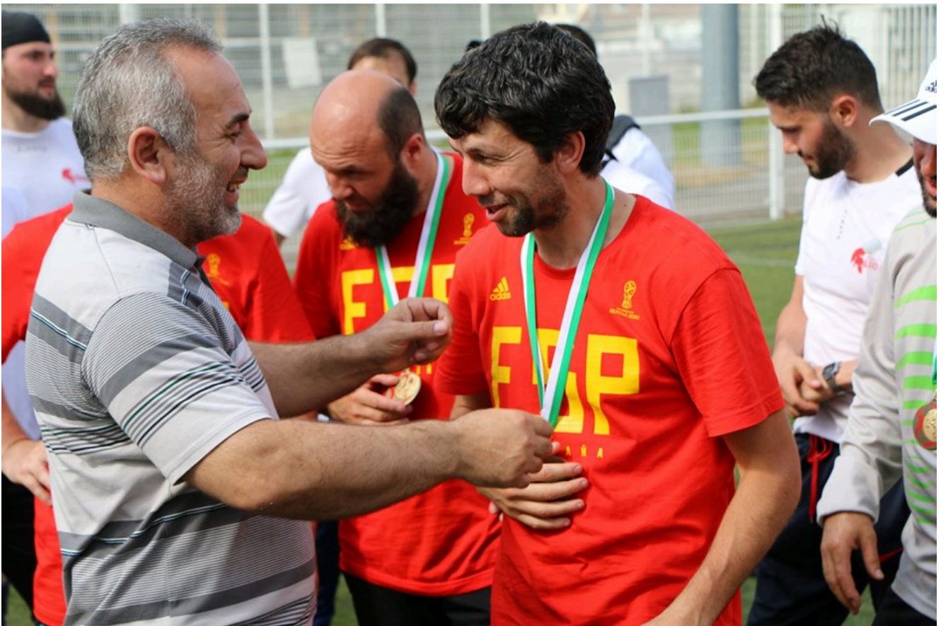
Президент ассоциации "Даймехкан кхерч" награждает финалистов.