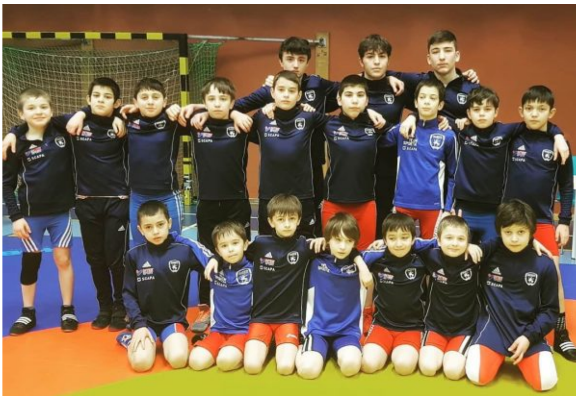
Команда БК «Альвеста» на Кубке Стэпфана