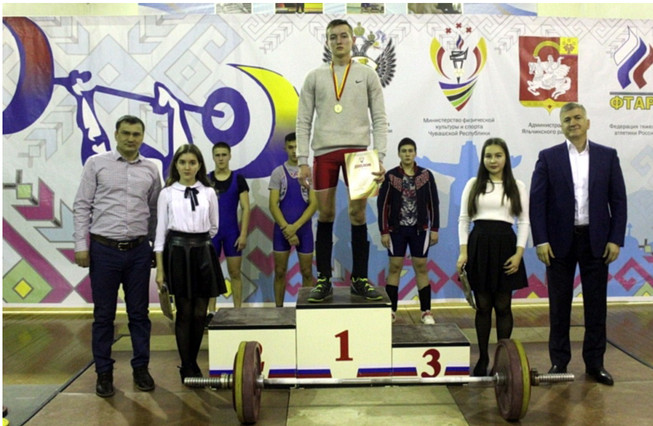
Справа отец Дени - Аюб Арсанукаев, известный чеченский меценат спорта и вице-президент Федерации тяжелой атлетики Чувашии.