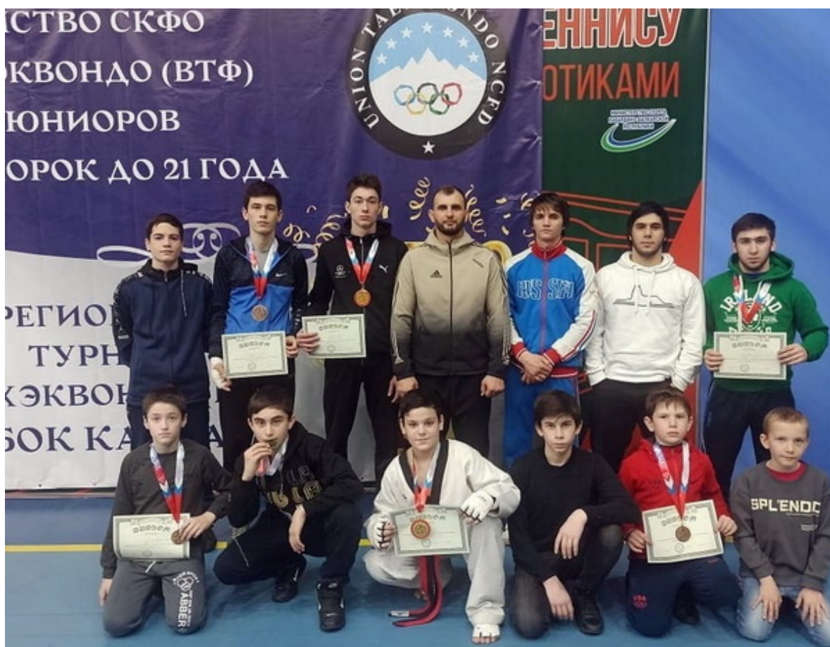
Чеченские тхэквондисты – призеры первенства СКФО

По итогам двух соревновательных дней «Кубка Кавказа» 1-ое общекомандное место заняла Кабардино-Балкария, на втором месте Республика Дагестан, на третьем – Северная Осетия.