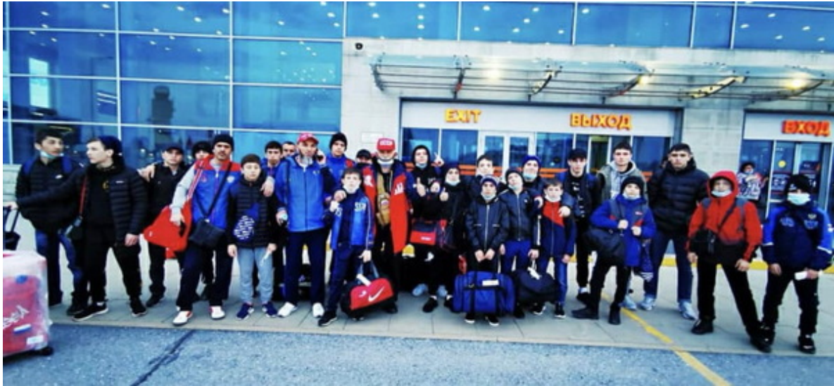
Команда Чеченской Республики на первенстве России