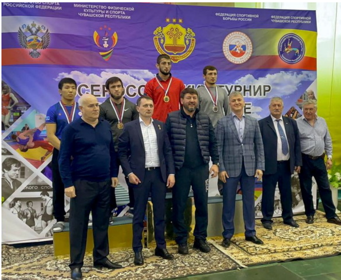
Награждение призеров весовой категории 70 кг

https://wsport.su/wp-content/uploads/2021/04/ayub_v.mp4