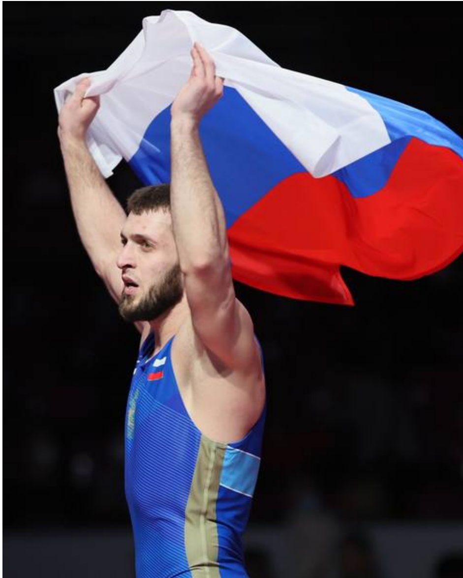
Чемпион Европы-21 Исраил Касумов