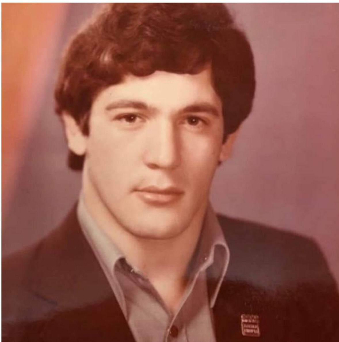
Хасан Баиев, 1984г.

кто к нему обращался – и чеченским ополченцам, и федеральным солдатам. За это преследовался обеими сторонами и в 2000 году эмигрировал в США.