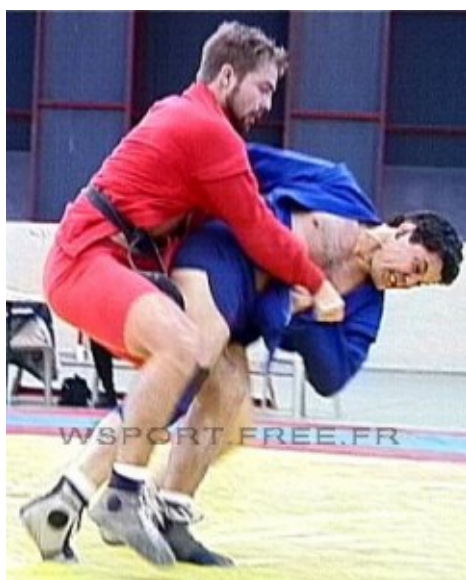
Хасан Баиев на Кубке мира-2001 в Ницце.

Всемирно известный хирург, во время чеченских войн освоил военно-полевую хирургию и оказывал медицинскую помощь всем,