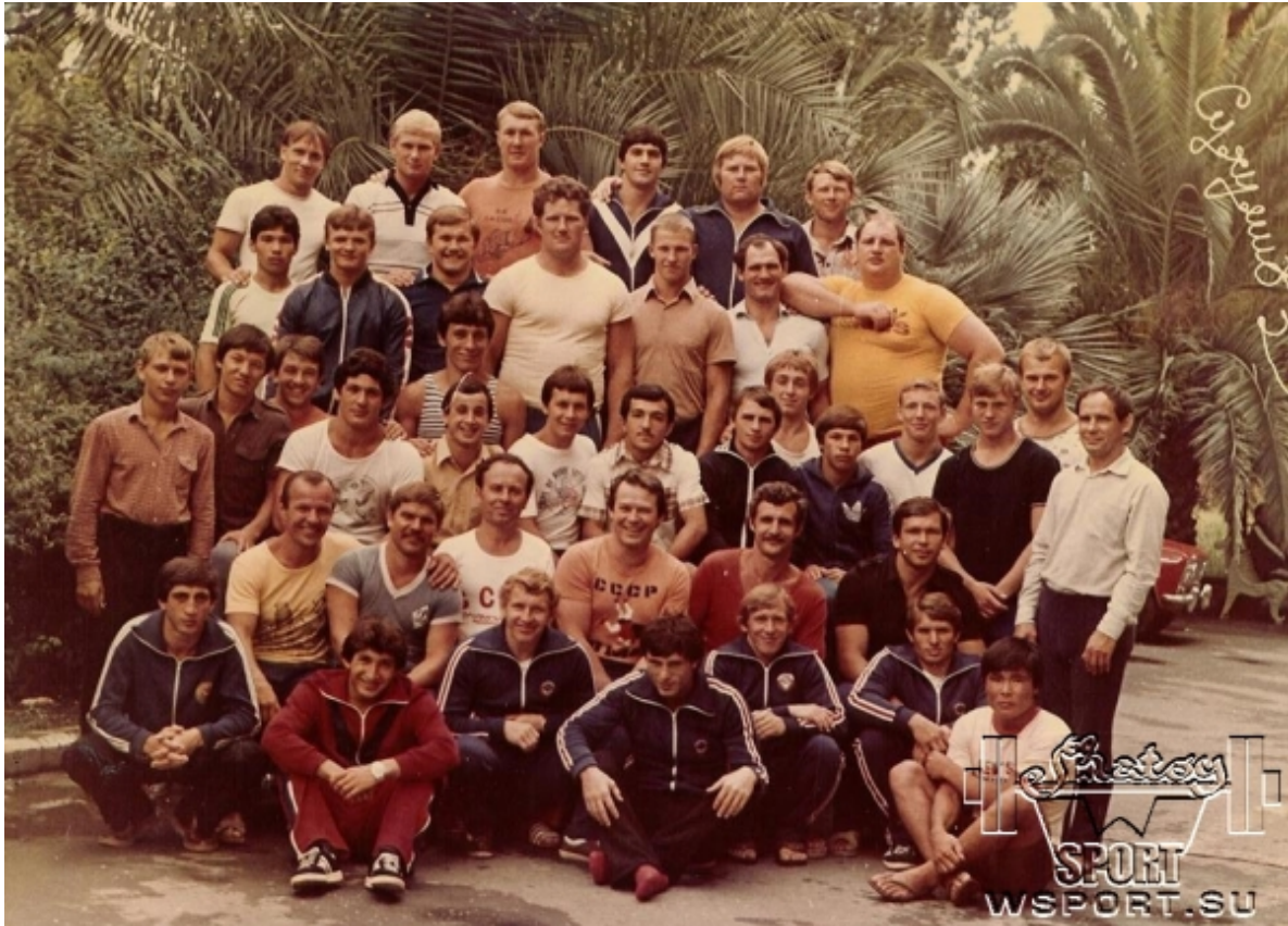
Хасан Баиев в сборной СССР