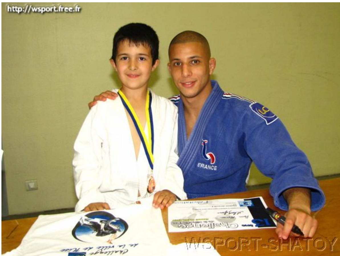
Чемпион Европы-2010 Софьян Милу подписывал дипломы призеров