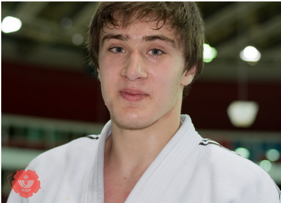
Сулим Мараев.