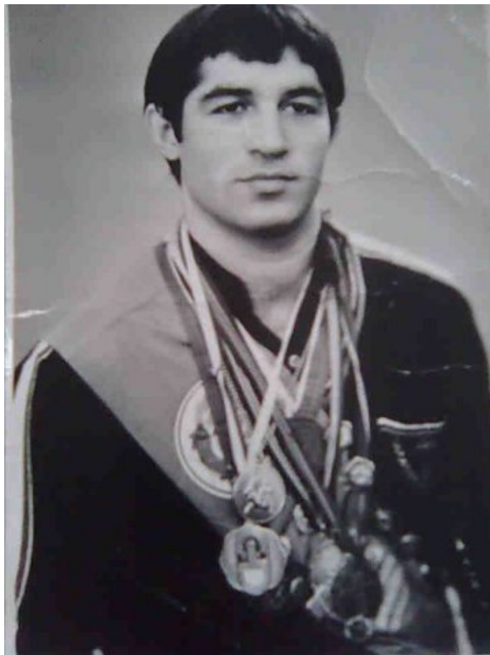
Магомед Парчиев.

2-3 мая прошел 17-й Всероссийский турнир памяти Магомеда Парчиева. В нем принимали участие 131 спортсмен. Самую большую команду выставили хозяева ковра – 54 спортсмена. От Чеченской Республики выступало 38 дзюдоистов, по 14 человек приехали из Северной Осетии и Кабардино-Балкарии, 7 – из Дагестана и 4 – из Карачаево-Черкессии. Как следствие, две самые большие команды завоевали почти все призовые места.