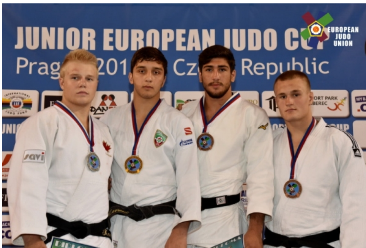
Мансур Лорсанов – обладатель Кубка Европы Чехия