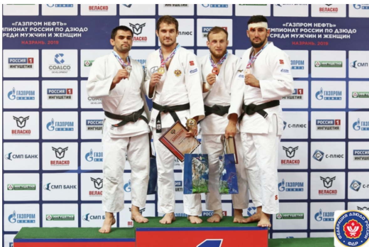
Призеры весовой категории 81 кг