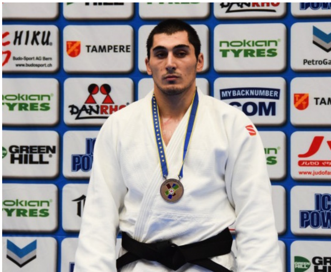
Зелимхан Башаев.