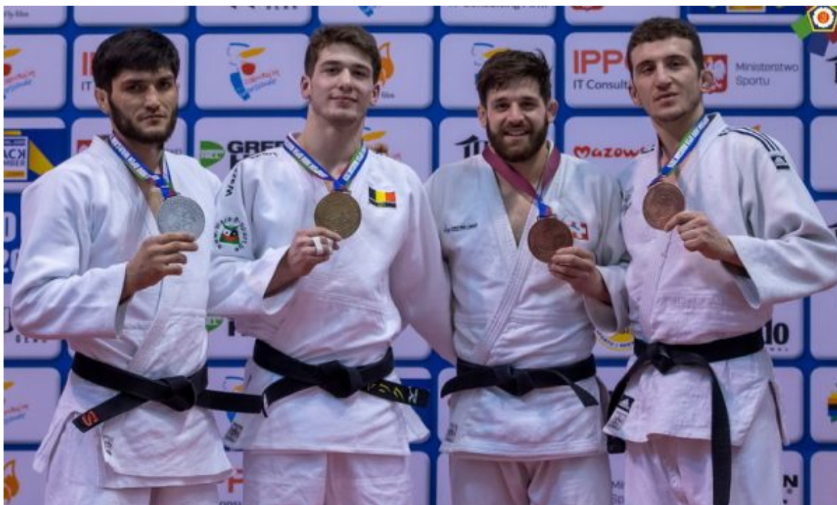
Абдул-Малик Умаев – победитель Европа Опен Варшава 2020.