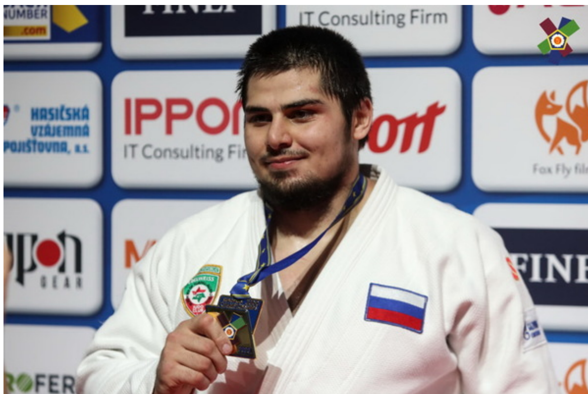
Тамерлан Башаев – чемпион Европы-20