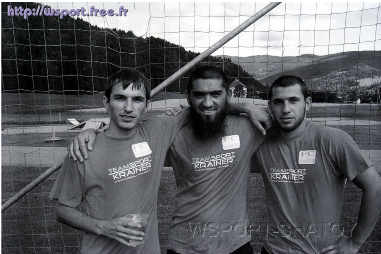
Игроки ФК "Нохчи"