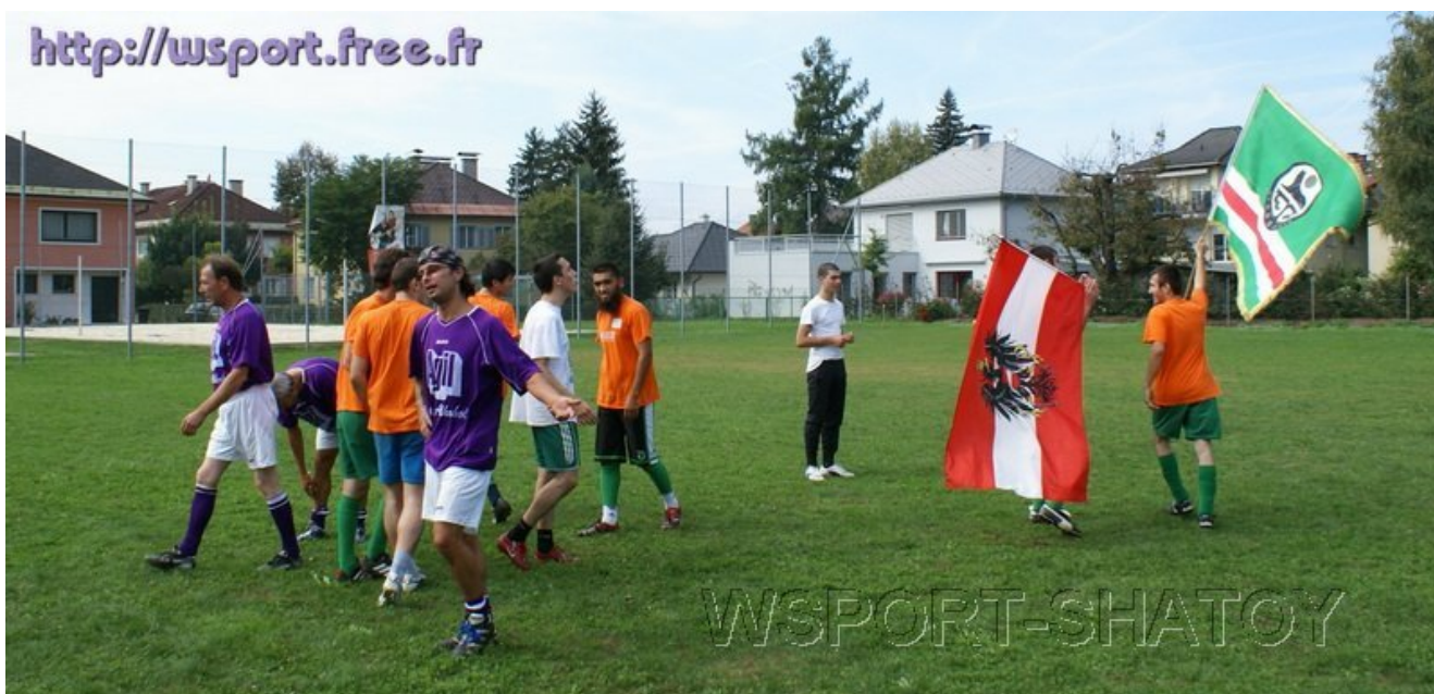
ФК "Нохчи" празднует победу