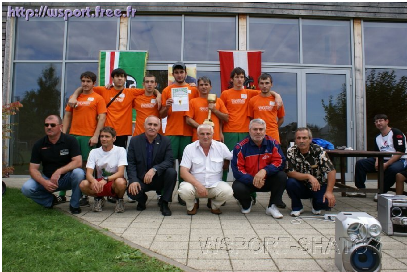
ФК "Нохчи" - победитель турнира