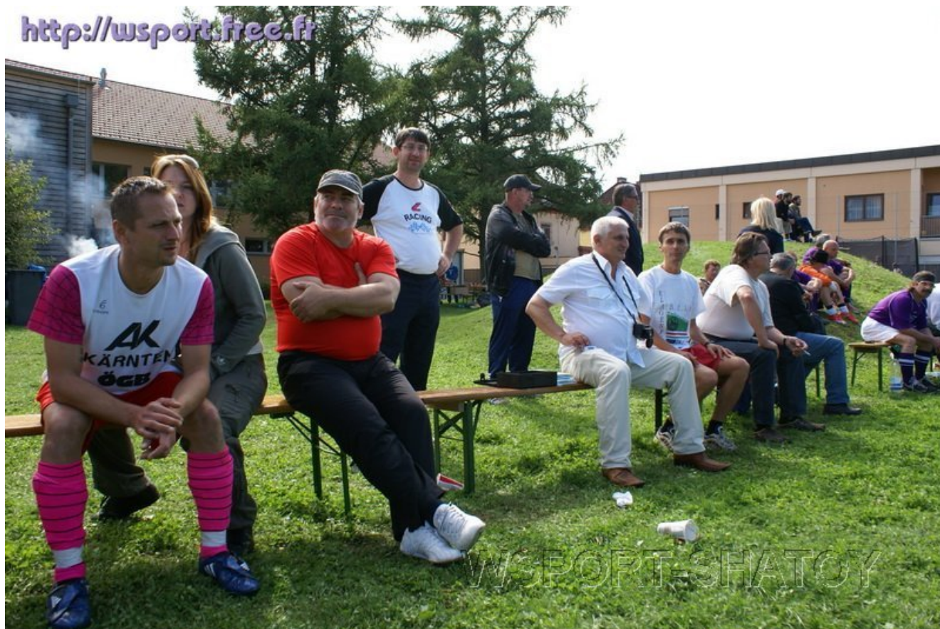
Организаторы, гости, запасные