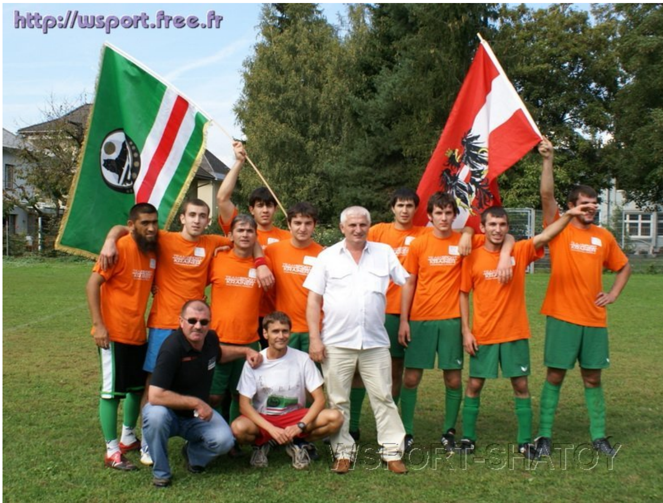
ФК "Нохчи" - победитель турнира