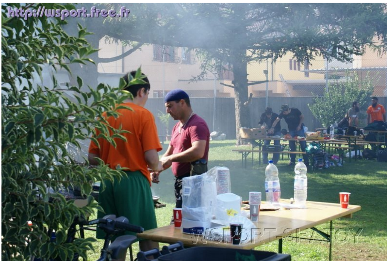
После турнира - шашлыки