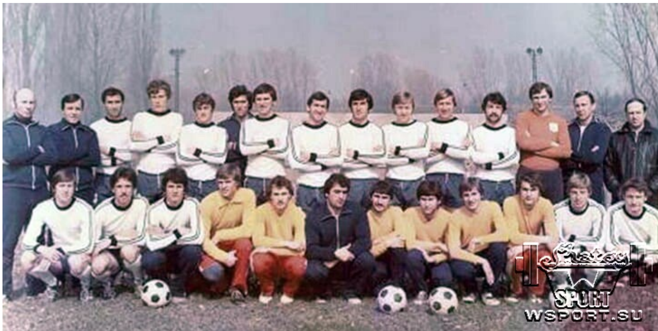
«Терек», 1982г .