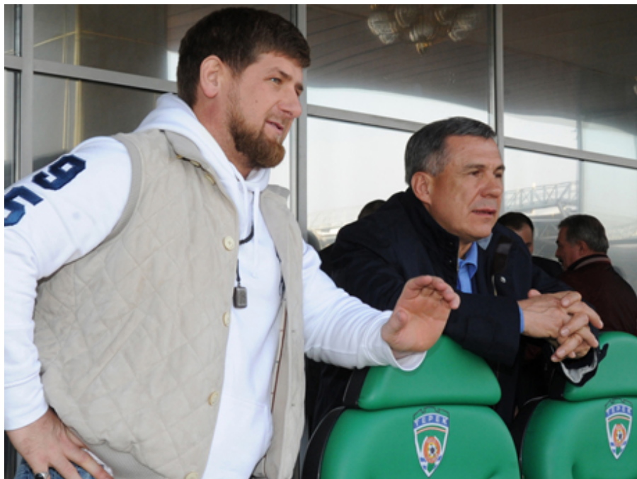
Рамзан Кадыров и Рустам Минниханов

Ну, а возвращаясь непосредственно к футболу, «Терек» после этого матча набрал 33 очка и занял 12-е место в чемпионате России. Если бы чеченский борец, штангист или боксер занял такое место, даже не на чемпионате России, а мира или Европы, мы расценивали бы это как полный провал. Но, в футболе, видимо, другие измерения и потому в него бухают такие средства, которые борцам со штангистами даже не снятся в волшебных снах, главным образом для того, чтобы не вылететь из высшей лиги. Сложно понять такую логику.