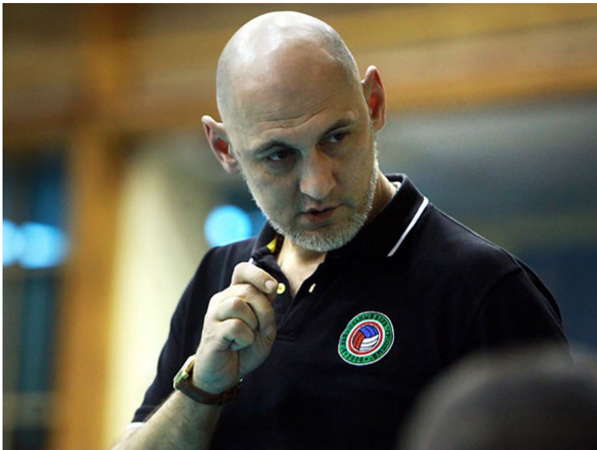
Арсен Кириленко