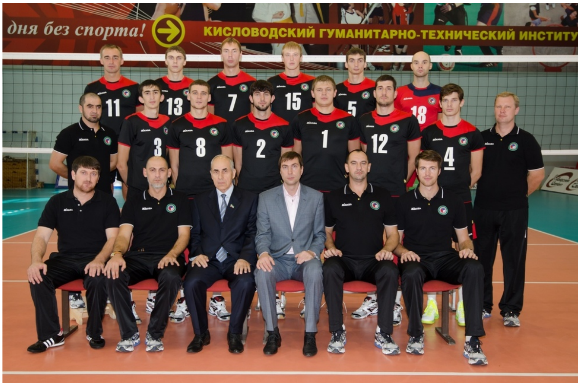
ВК «Грозный», 2012г.

Р.С. В то время, когда готовилась эта статья, на сайте Главы и Правительства Чеченской Республики появилось следующее сообщение: