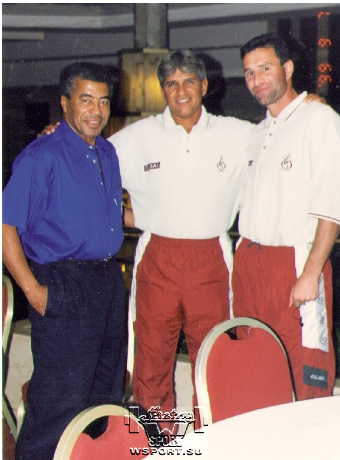
Слева легендарный бразильский футболист Жаирзиньо

На базе ЦСКА соседствовали армейские футболисты и хоккеисты. Со многими известными хоккеистами, которые потом блистали в НХЛ, мы дружили. Был знаком и с легендарным хоккейным тренером Виктором Васильевичем Тихоновым, не раз доводилось общаться с ним. Можно еще назвать немало имен. Я вообще благодарен спорту, что познакомил меня со многими выдающимися личностями.