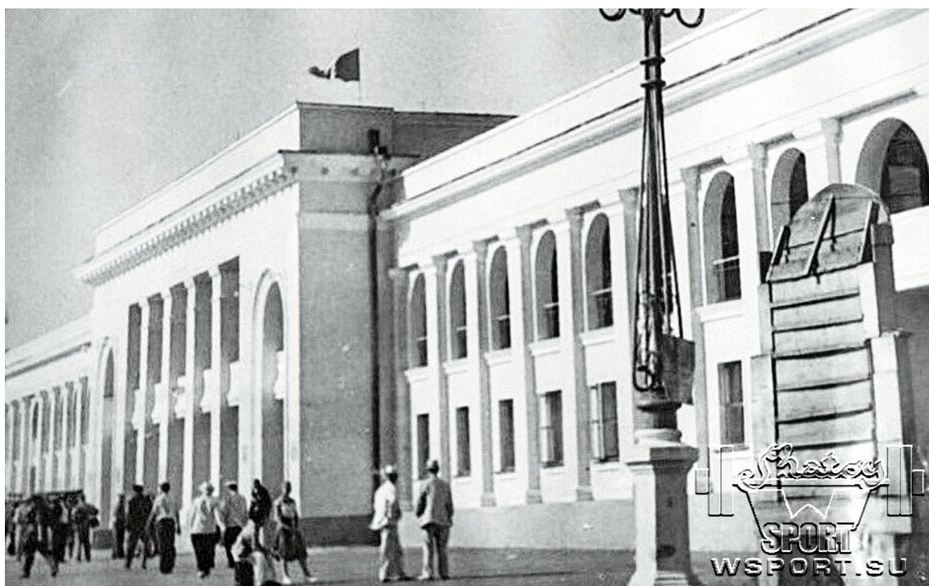
Вход на стадион им.Орджоникидзе