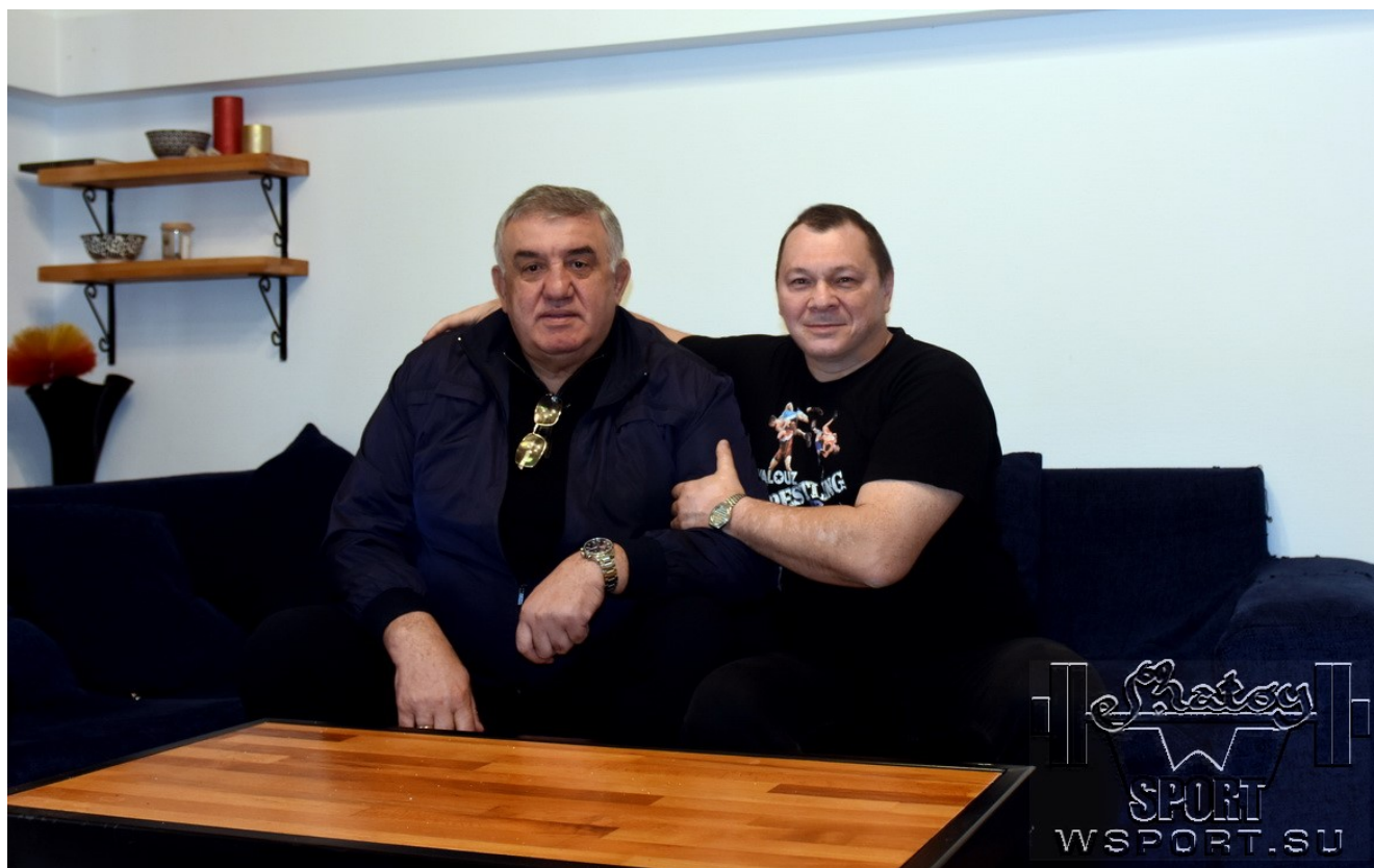
Давид Гобеджишвили и Муслим Гапуев

( смотрите здесь ), двукратным чемпионом мира (1985 и 1990 гг.), обладателем Кубка мира 1988 года. И в финалах всех этих турниров ему противостоял Баумгартнер. Но и американец, одержавший в своей карьере две победы на Олимпийских играх (плюс олимпийские «серебро» и «бронза»), трижды становившийся чемпионом мира и семь раз (!) – обладателем Кубка мира, тоже в долгу не остался. Одну из своих золотых олимпийских медалей, а конкретно на Играх 1992 года, он завоевал, пройдя Давида Гобеджишвили. В финале чемпионата мира 1986 года и полуфинале Кубка мира 1990 года Брюс также был сильнее Давида. Эти схватки все любители борьбы среднего и старшего возраста хорошо помнят.