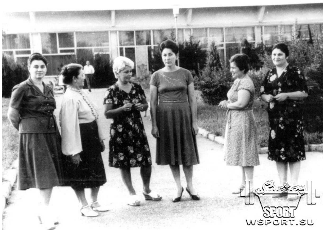
1988 год. Слева мать известного спортивного журналиста,