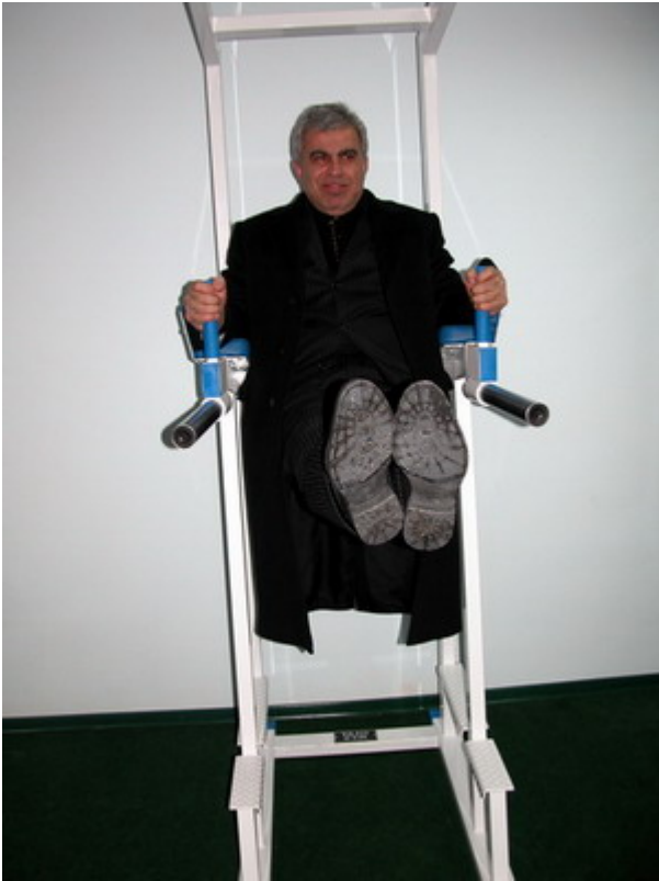
Министр держит "угол"