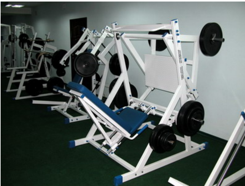
Тренажеры - что надо.