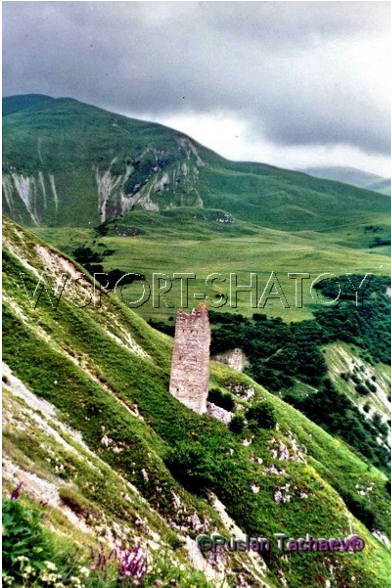
Чіеберла - Ачал.