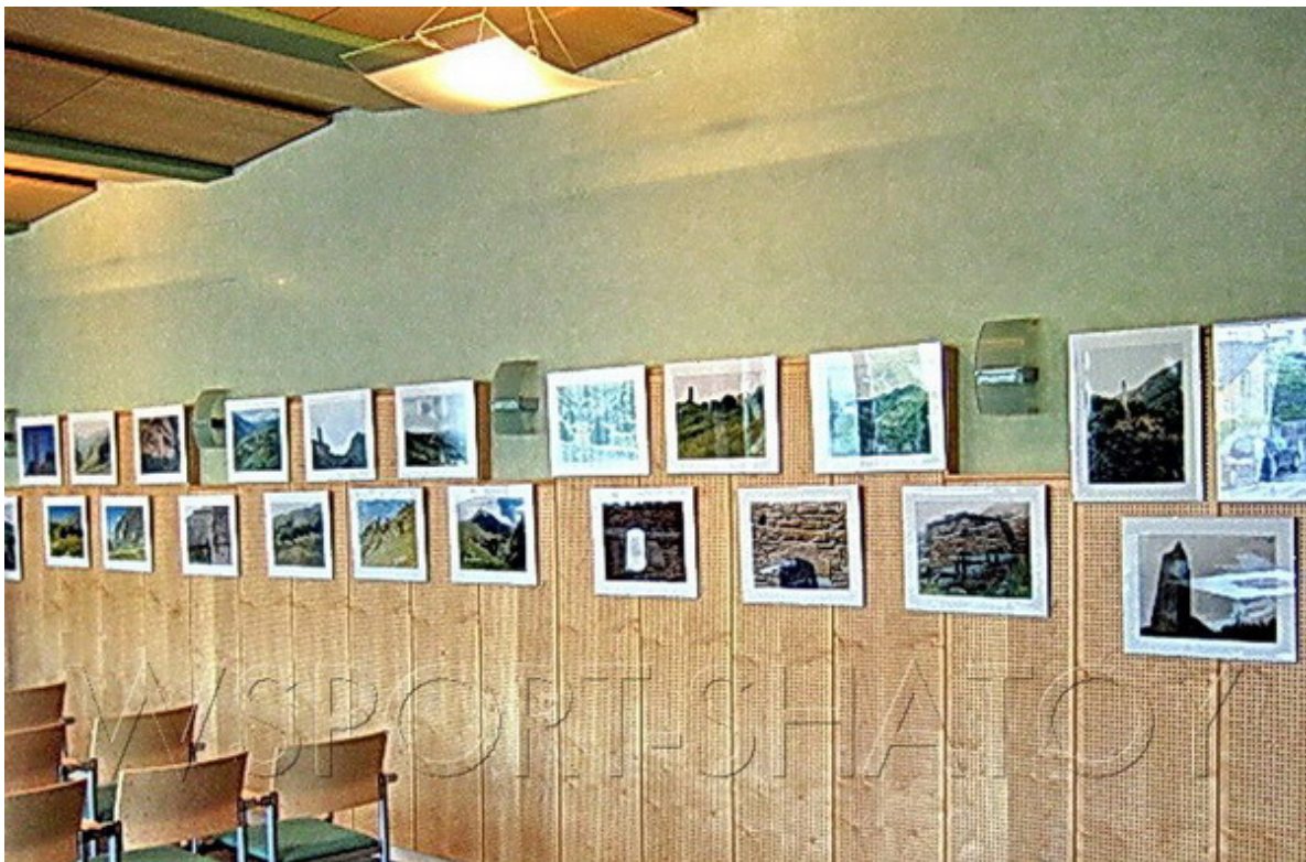
И еще одна