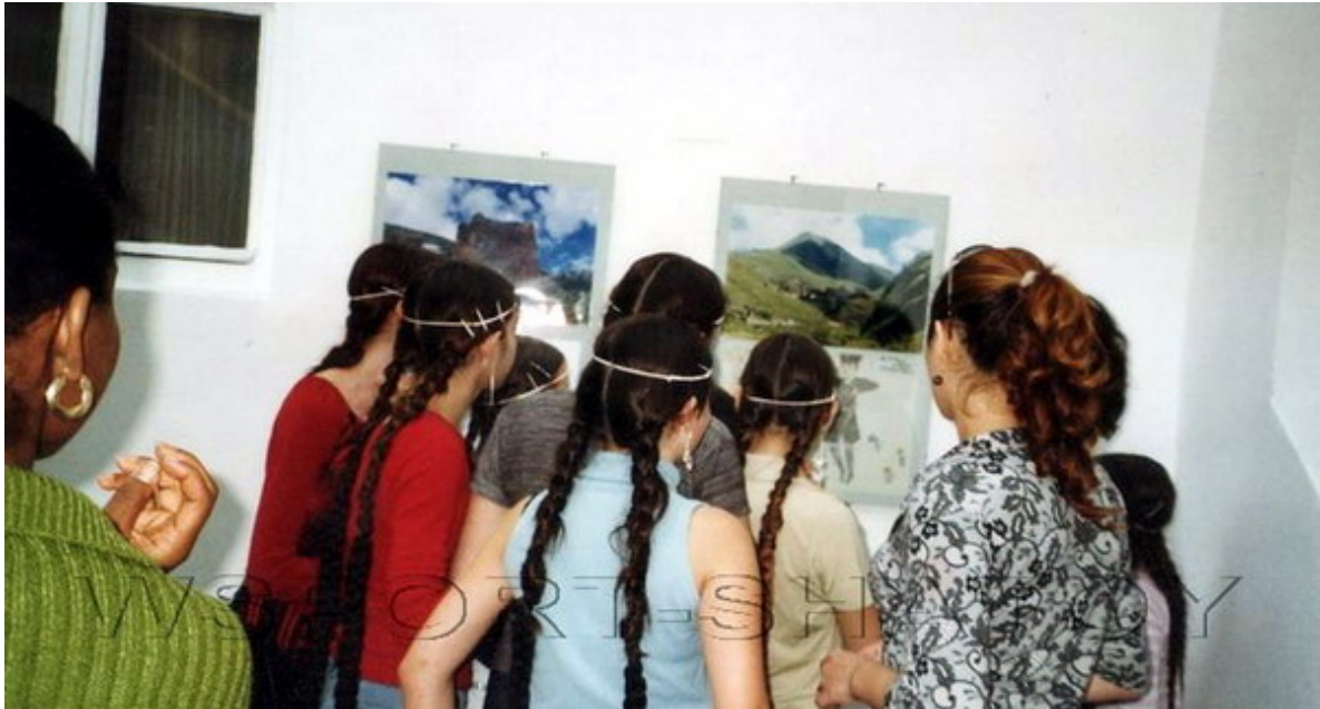
Выставка фоторабот Р.Тахаева в Австрии