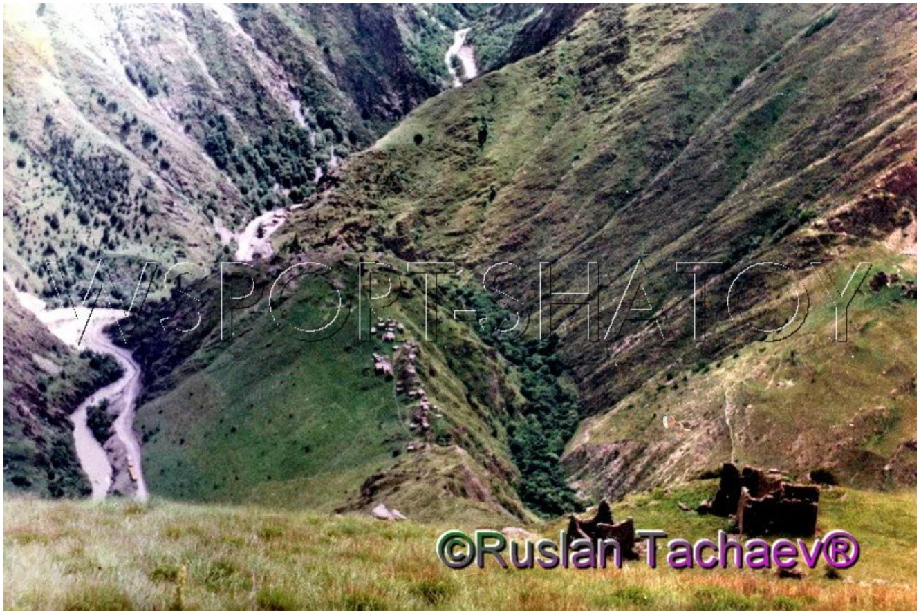
Малхйисте. Вид сверху на Мертвый город.