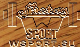
"Золотая борцовка" Бувайсара Сайтиева