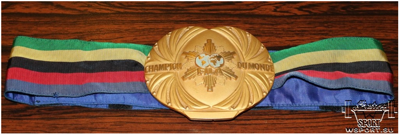
Награды Бувайсара Сайтиева