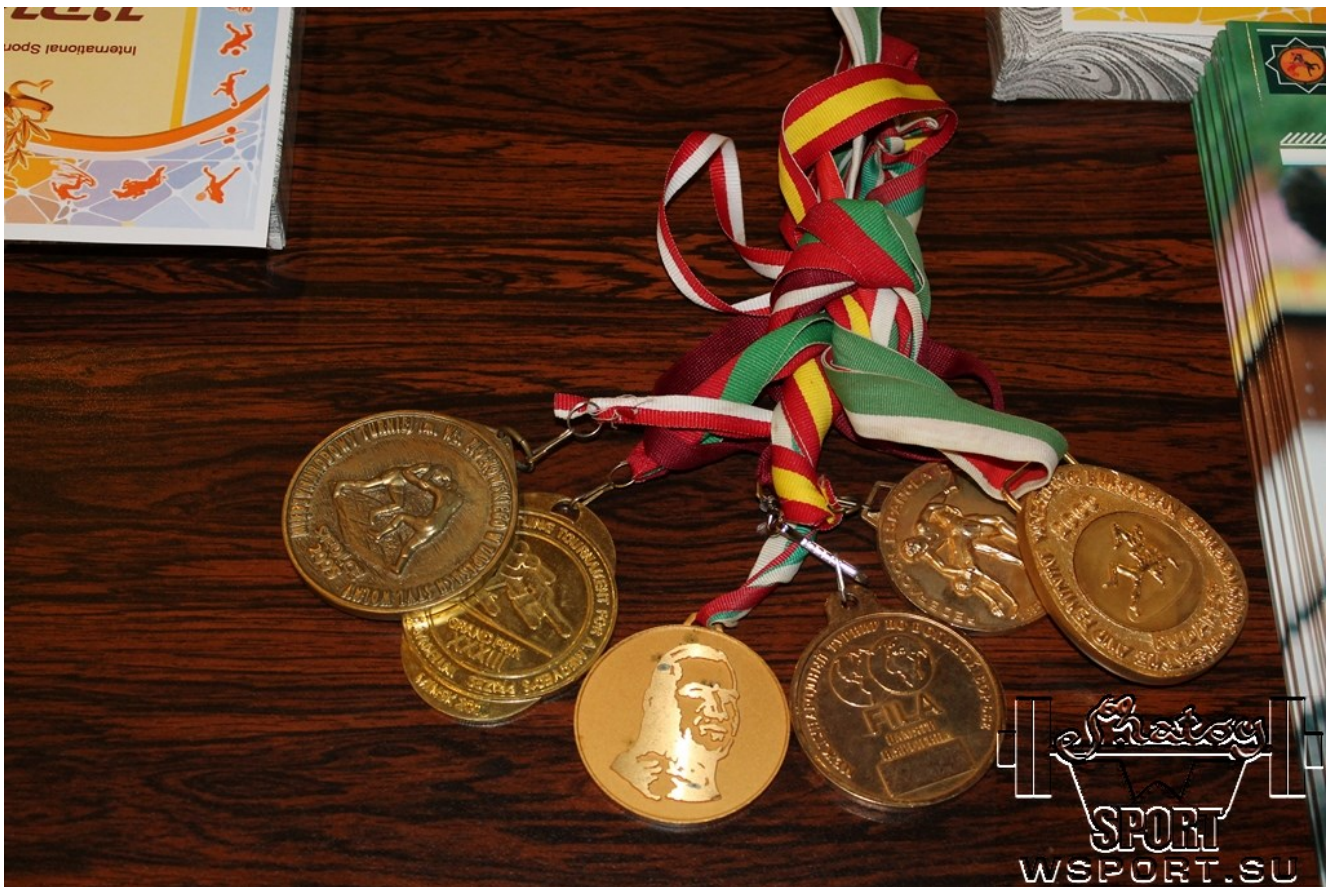
Награды Бувайсара Сайтиева