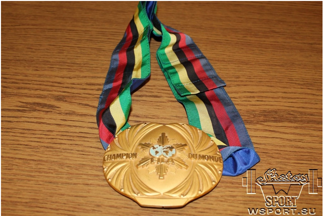
Награды Бувайсара Сайтиева