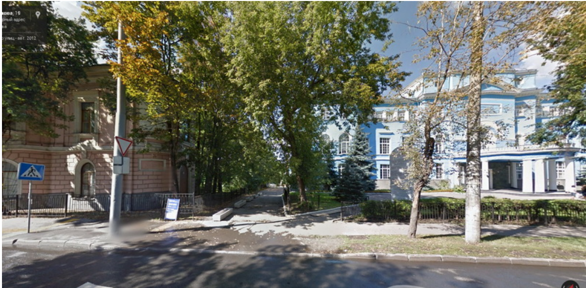
Современное фото. Голубое здание – бывшая столовая ТСХА, слева – кафедра лесоводства.

Какие только вкусности там не готовили! Разные салаты, первые блюда (супы, борщи, а летом – вкуснейшая окрошка), разнообразные вторые блюда из рыбы и мяса, сырники и запеканки, густая сметана и многое другое. В отличие от большинства учреждений общепита СССР, всё это было по домашнему вкусно и, что было характерно для советских столовых, совсем недорого. Можно было досыта поесть за 50 копеек и налопаться от пуза за 1 рубль.