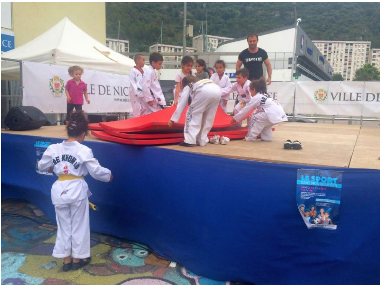
Подготовка места представлений

[youtube id=»xgG9FzHn-ew» width=»600″ height=»350″]