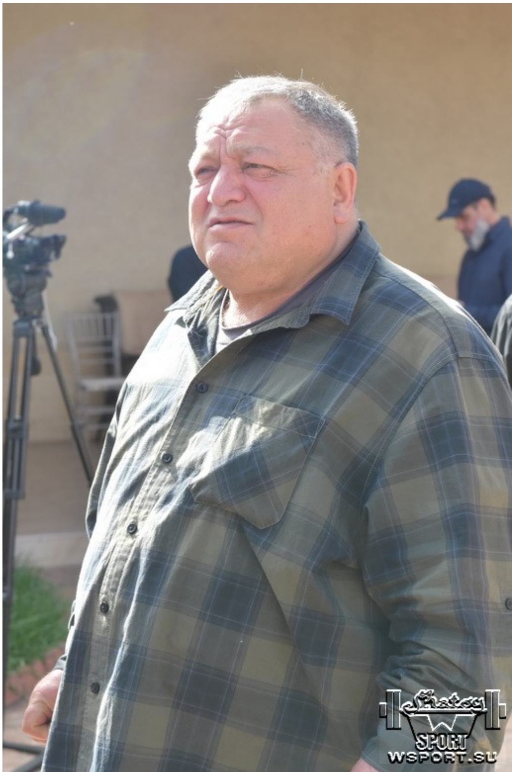
Победитель Олимпийских игр 1988 года по тяжелой атлетике Исраил Арсамаков