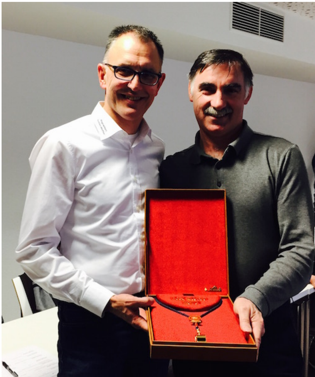
Судья олимпийской категории Уве Манц и Иса Гамбулатов