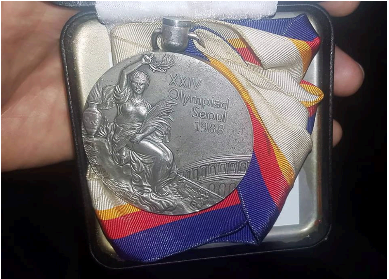
Олимпийская медаль Адлана Вараева