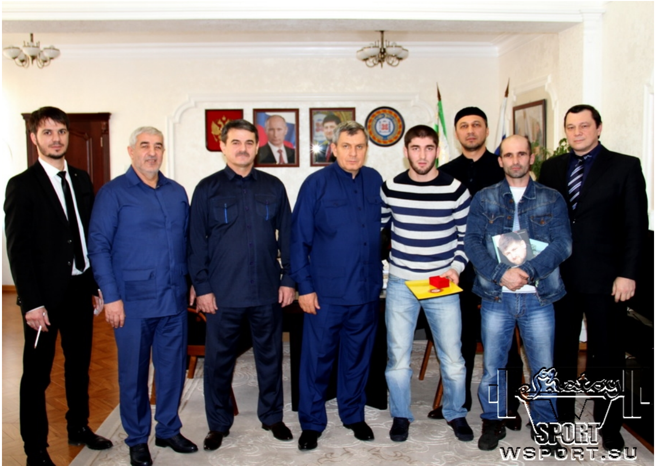
В Парламенте ЧР