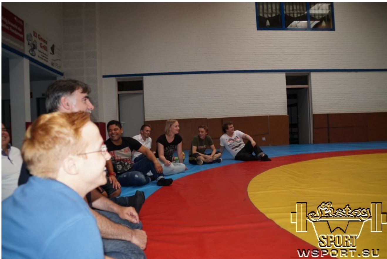
На практических занятиях