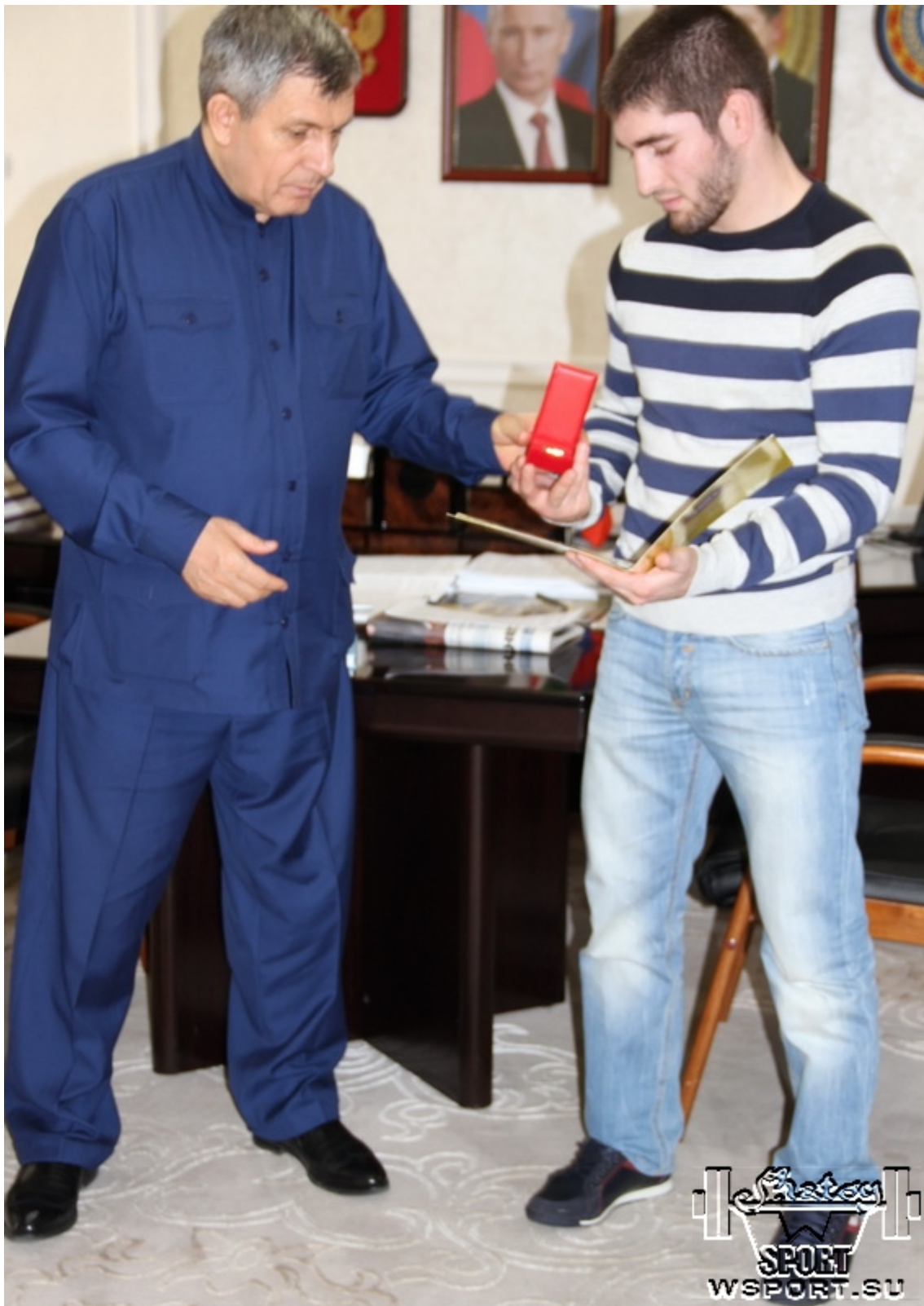
Вручение Почетной грамоты Парламента ЧР