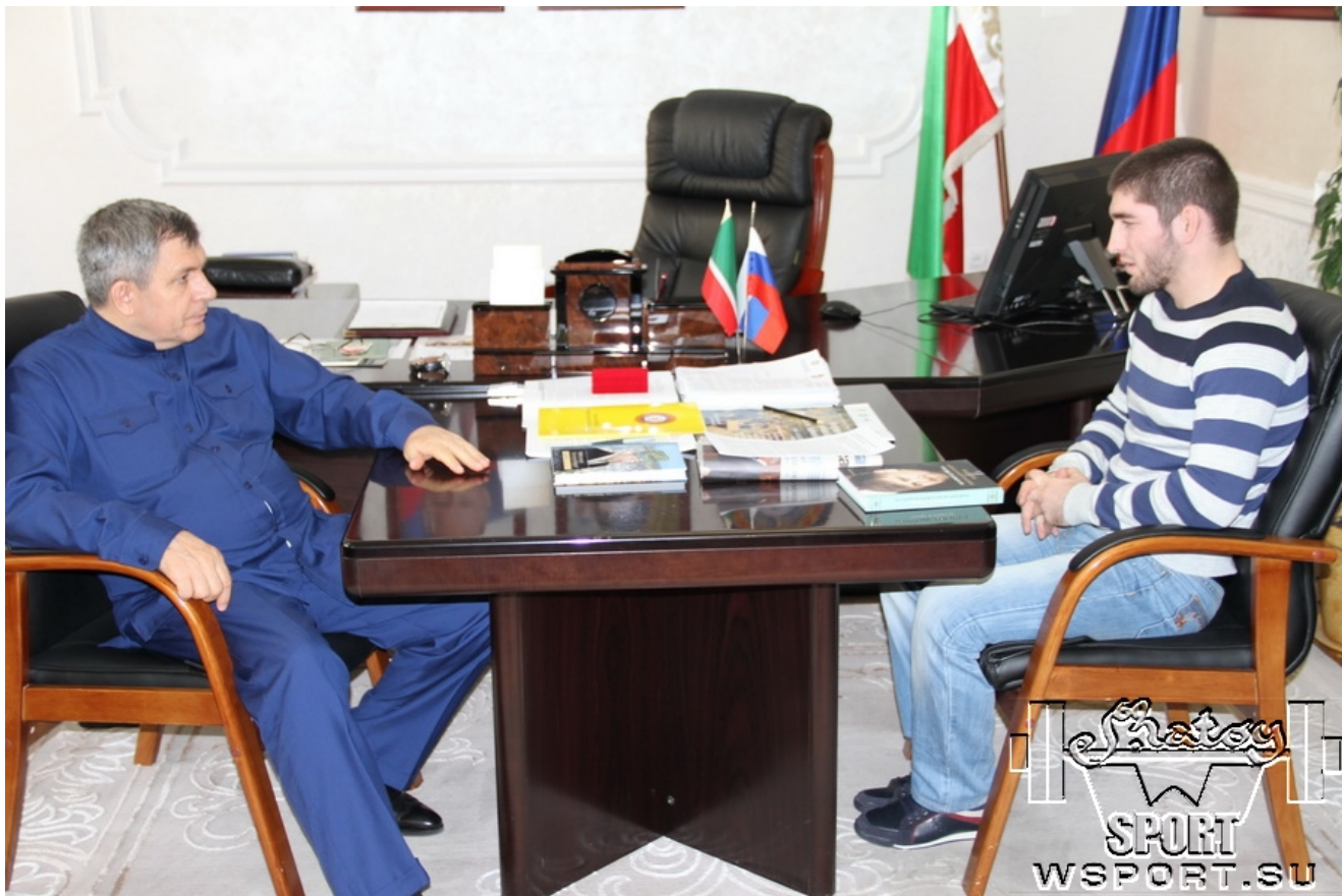
Беседа с председателем Парламента ЧР Дукувахой Абдурахмановым