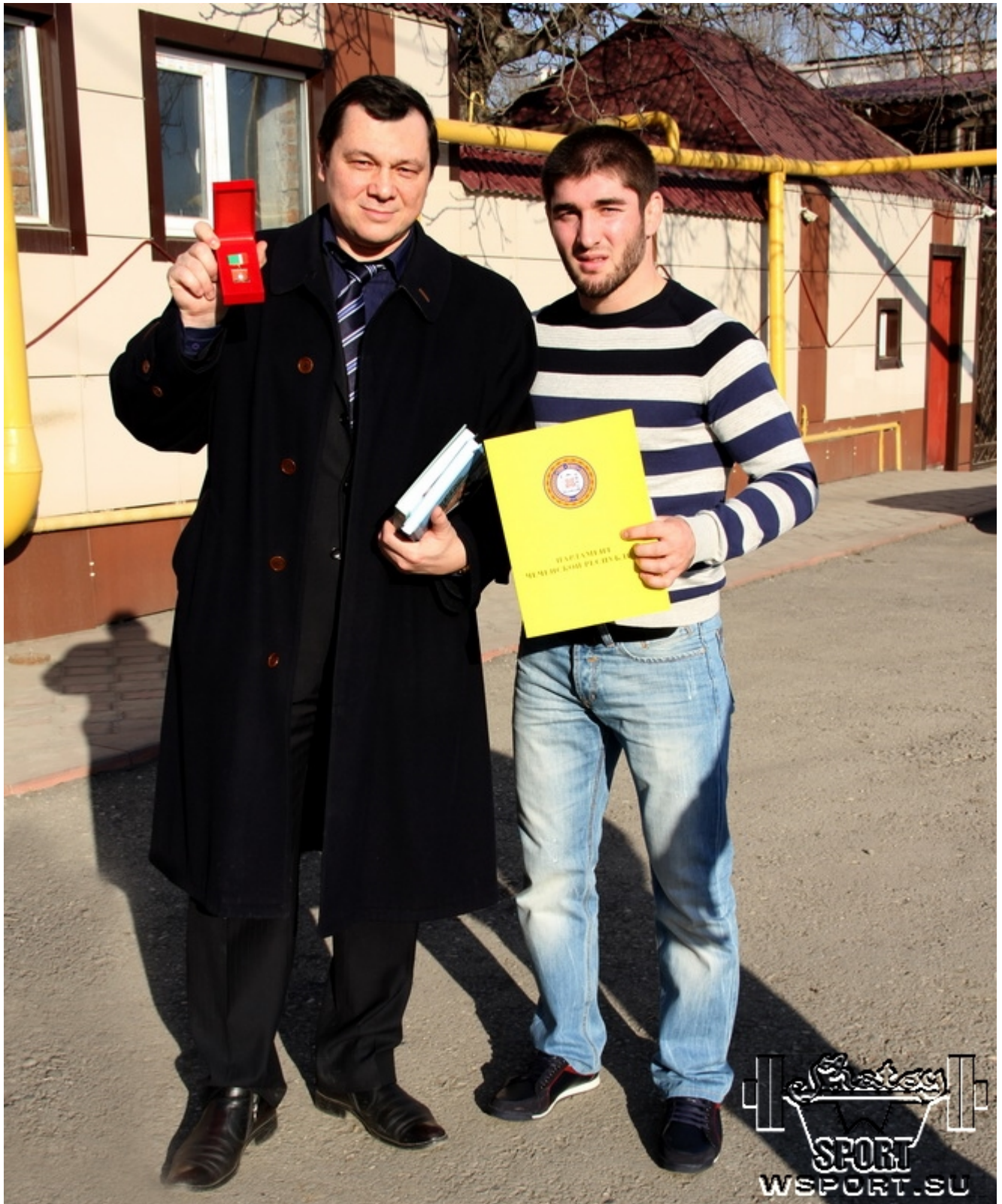
Муслим Гапуев и Чингиз Лабазанов после встречи в Парламенте ЧР