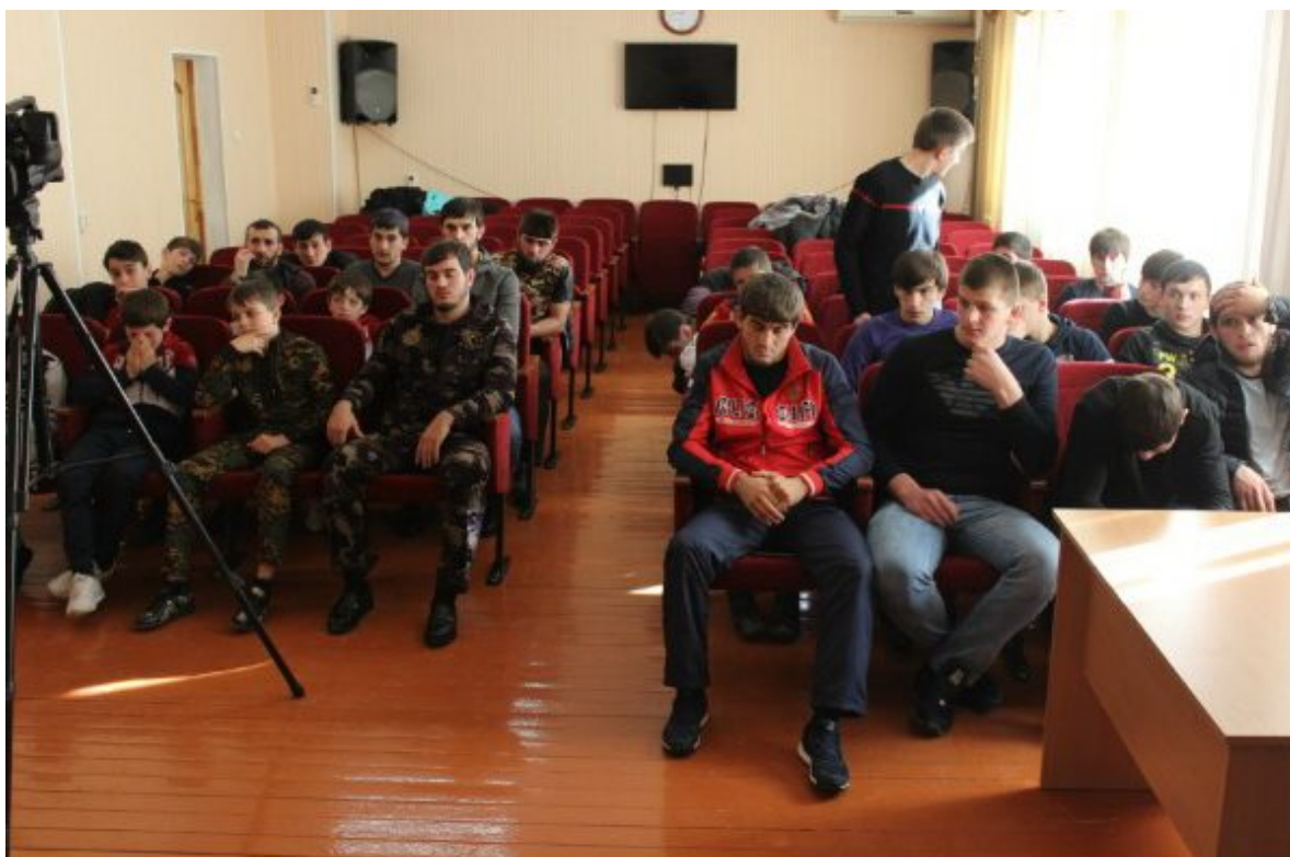
Перед началом церемонии награждения

призерами первенства мира в Баку. Спортсменам были вручены почетные грамоты и денежные вознаграждения от Регионального общественного фонда им. Ахмат-Хаджи Кадырова.