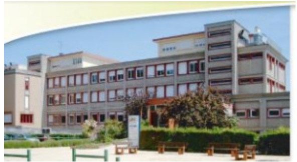
CREPS города Макон

Успешно расправившись с устным экзаменом и окрыленный этим успехом, через три месяца, в июле 2007-го я взял курс на город Макон (недалеко от Лиона), чтобы пройти последний этап – практический экзамен. В отличие от волнений и бессонниц, имевших место перед устным экзаменом, на этот раз я был спокоен и уверен в себе как слон.