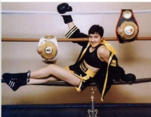
Zulfia Koutdussova Championne du Monde 5 fois : - IWBF - WBF - FBA - WBF