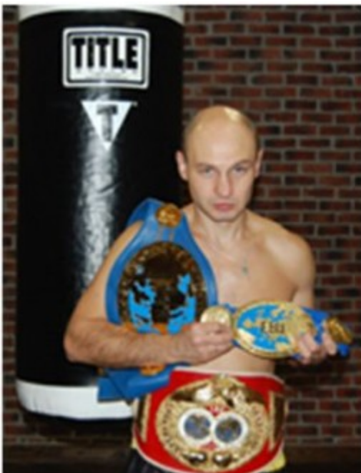
Boris Sinitsin Champion du Monde 2 fois : Champion d'Europe 7 fois Boxe Professionnel