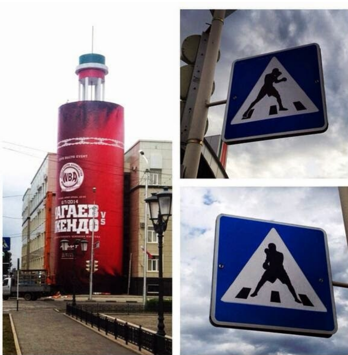
Грозный в преддверии поединка Чагаев-Окендо

Тем временем, в Грозном готовятся к небывалому шоу с использованием грандиозных световых, звуковых и прочих эффектов при помощи самых современных технологий. На мероприятие приглашены знаменитые боксеры прошлого Майк Тайсон, Рой Джонс, Леннокс Льюис, Эвандер Холифилд, а также звезды российского шоу-бизнеса.