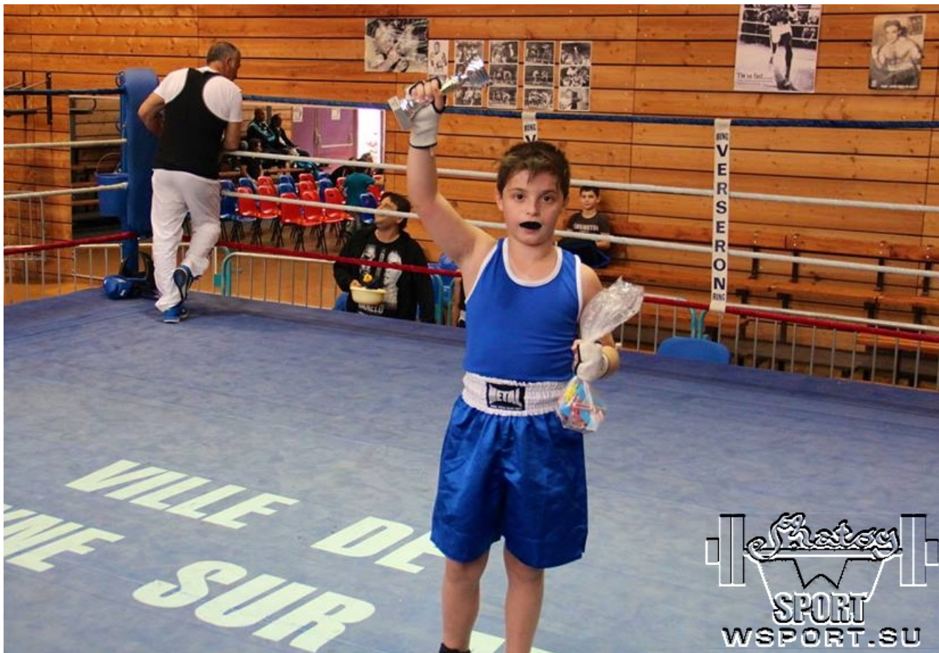
Адам становится чемпионом