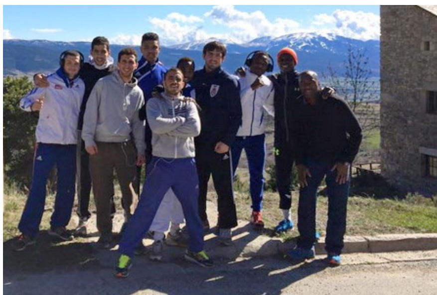
Французская команда в Сербии