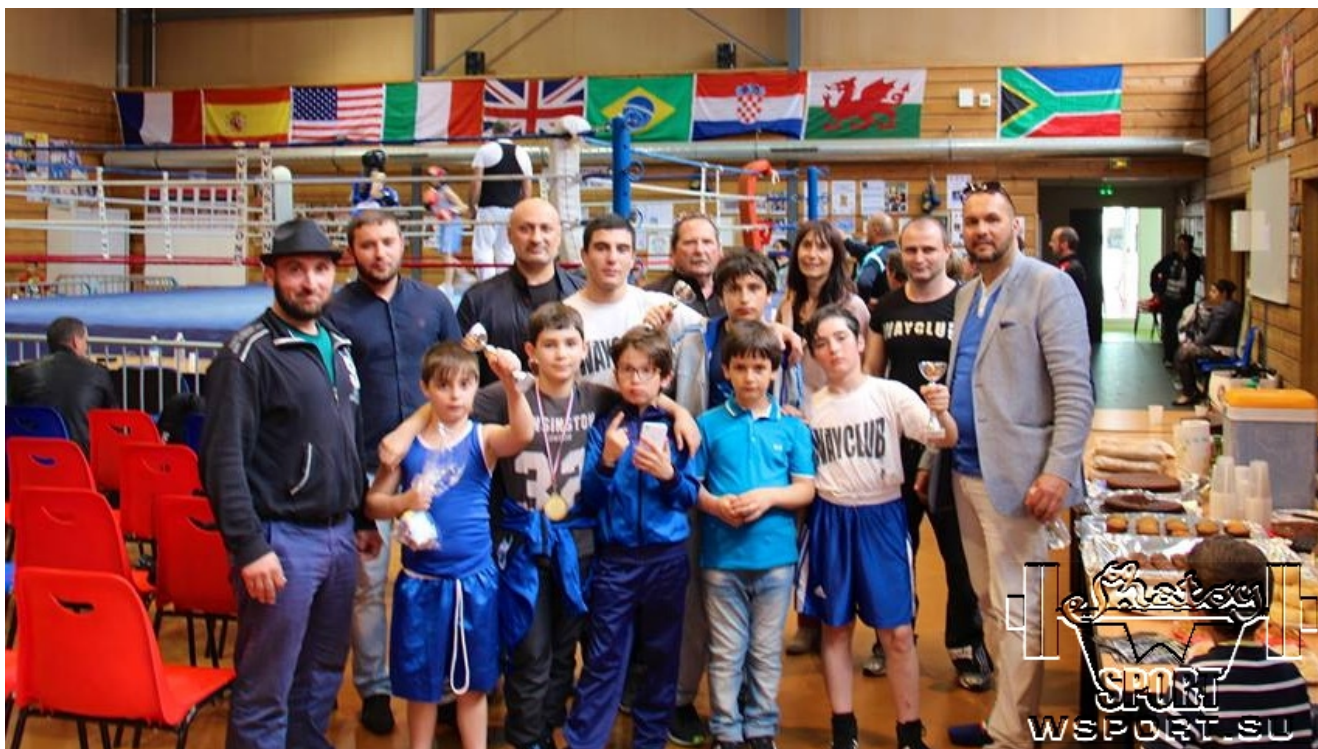
Представители мэрии и руководство клуба Сен-сюр-Мера с командой "Вайклуба"