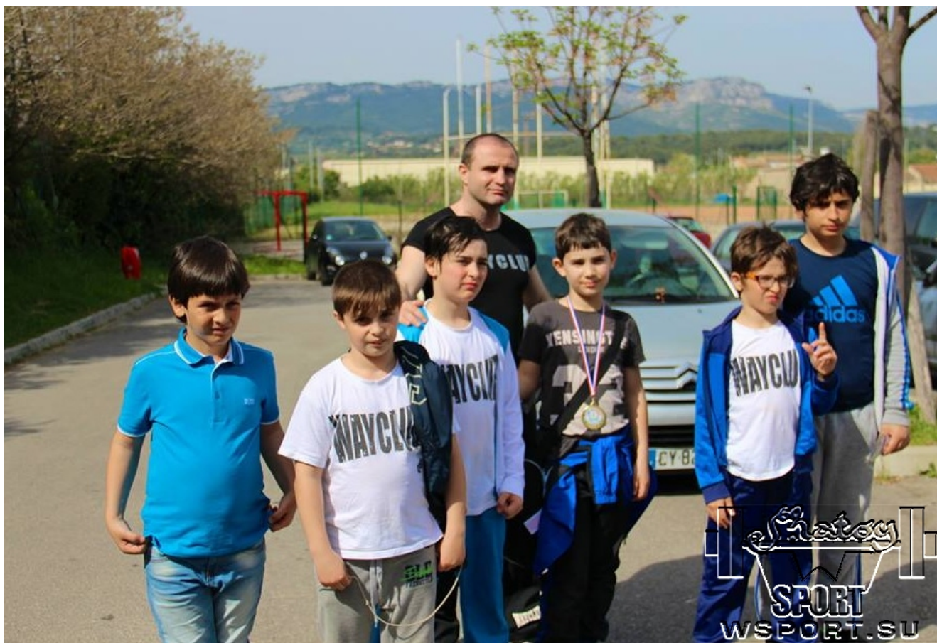
Спортсмены "Вайклуба" прибыли на соревнования