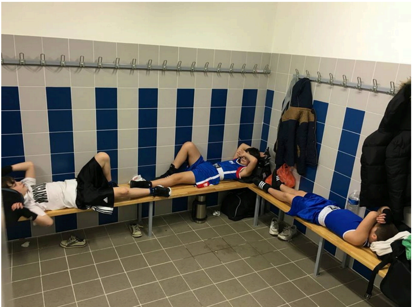
Боксеры Wayclub отдыхают перед боями