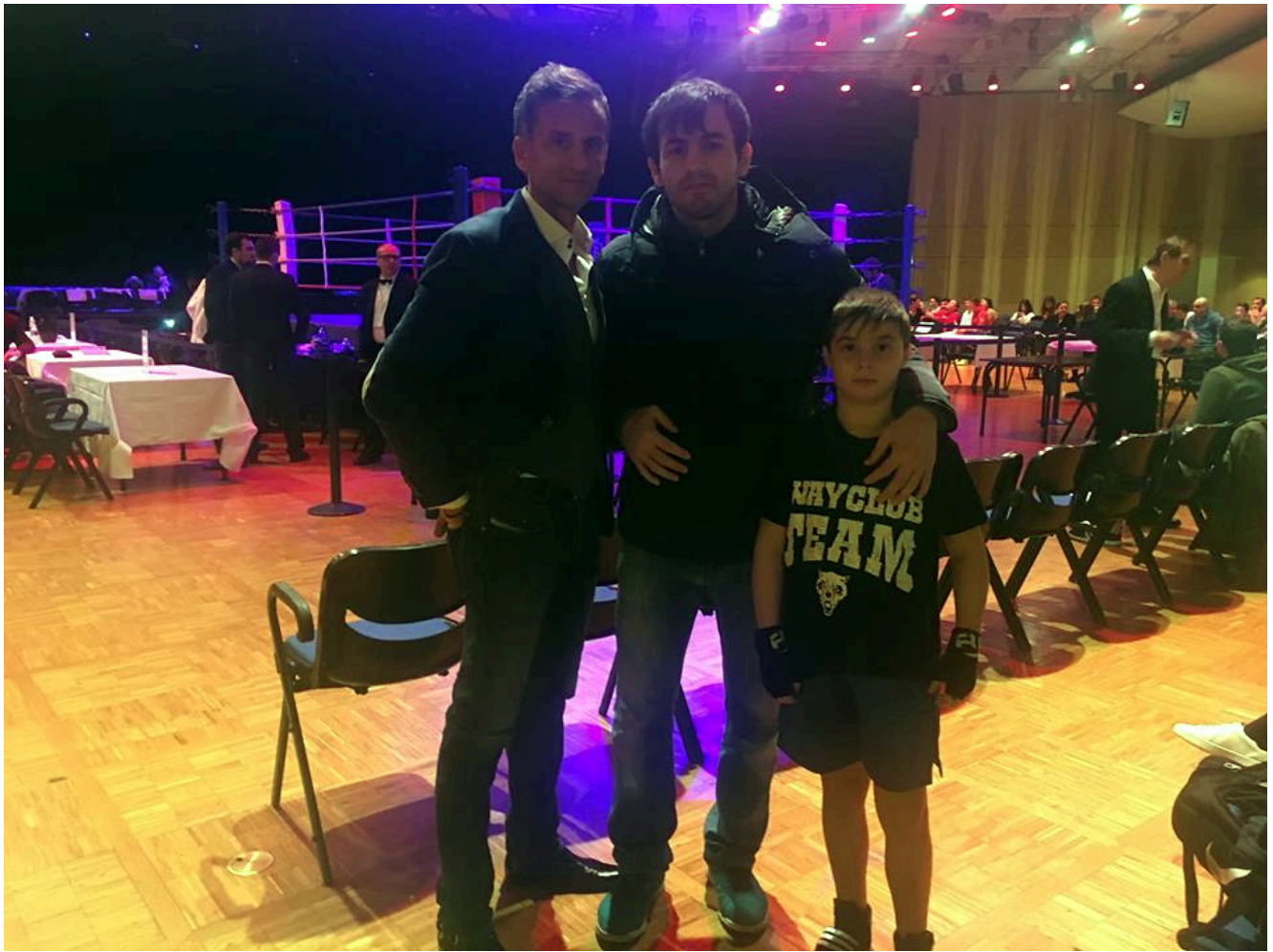
Чемпион Франции Сулиман Абдурашидов