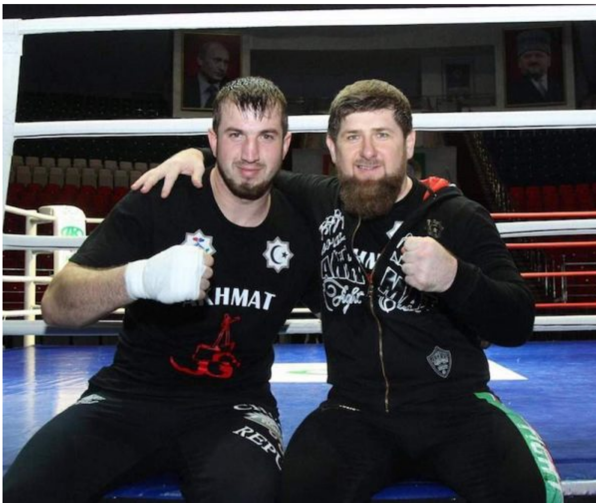
Апти Давтаев и Рамзан Кадыров