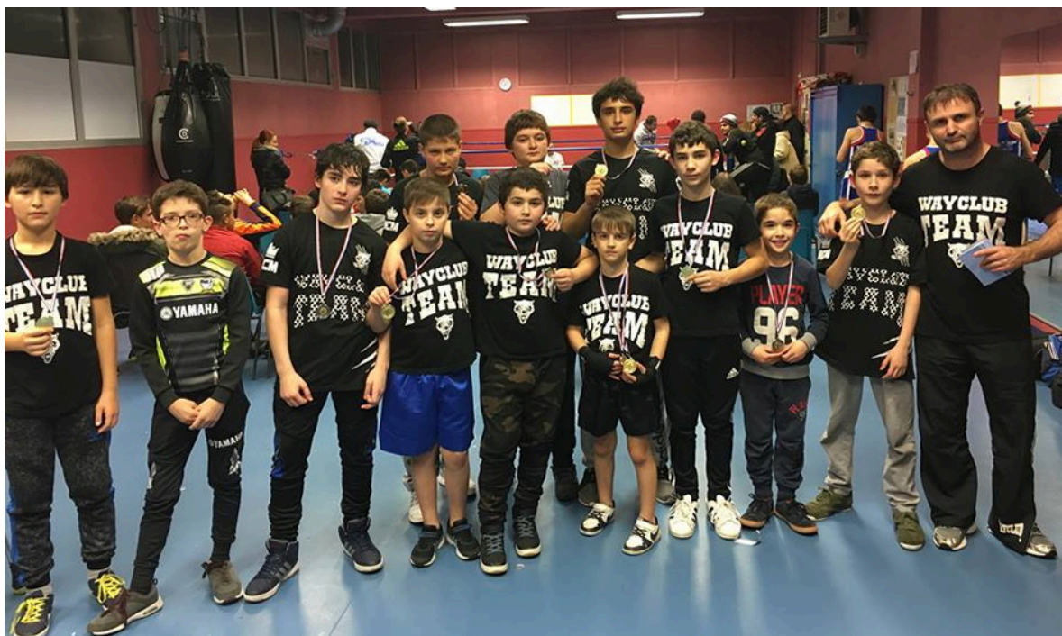
Команда «Вайклуб» (Wayclub) на чемпионате департамента Приморские Альпы (Alpes-Maritimes)

Ну, да ладно, оставим эти проблемы на совести региональной федерации бокса, для нас важнее, что «Вайклуб» показал на этих соревнованиях блестящий результат, доказав что является одним из лучших боксерских клубов Ниццы.