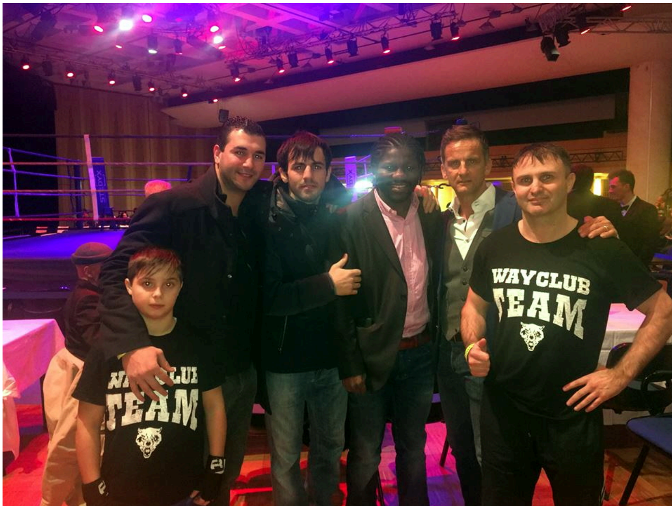
В центре чемпион мира-12 по версии WBO Хассан Н'Дам Н'Жикам.