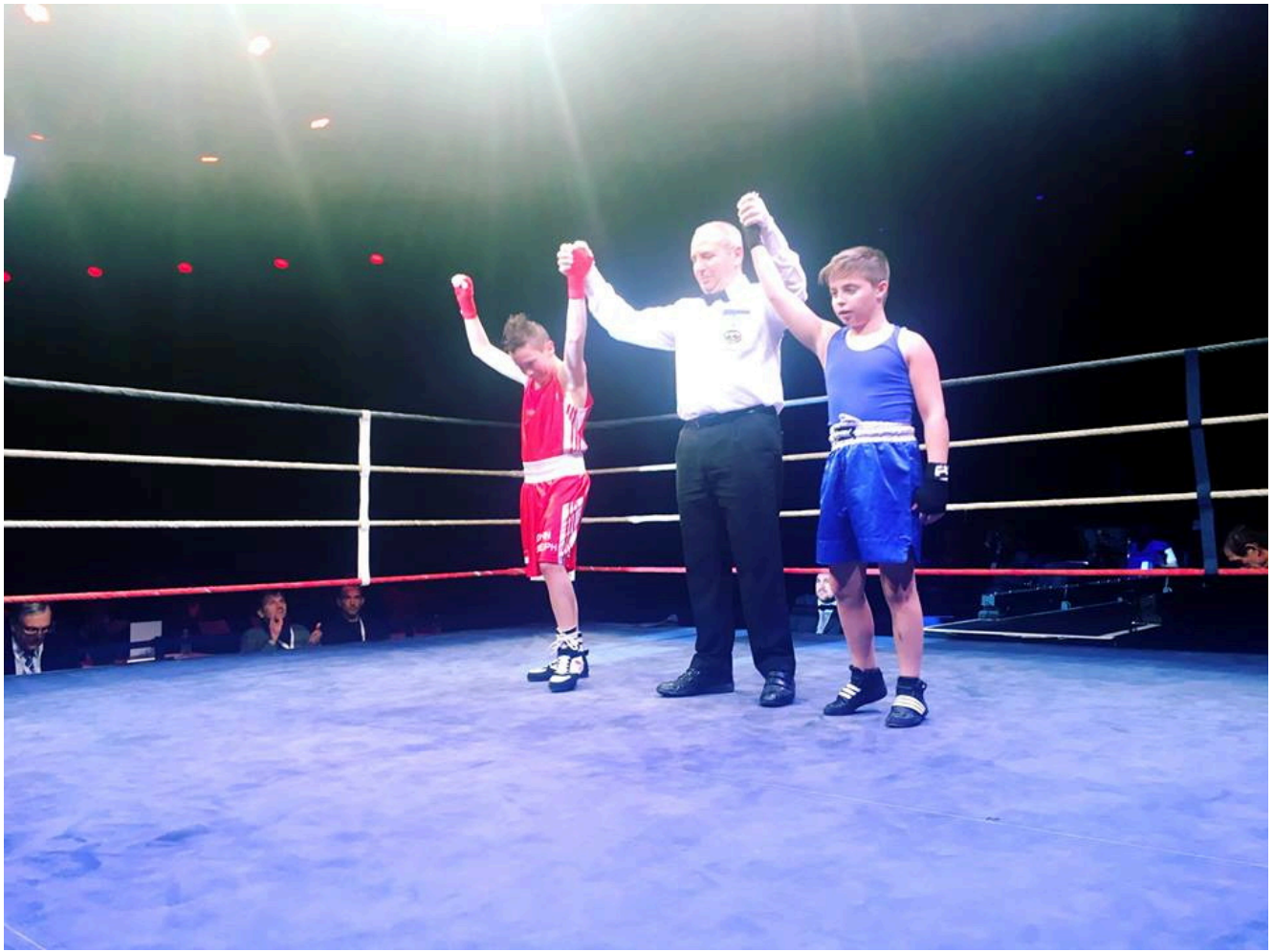
Бой был равным