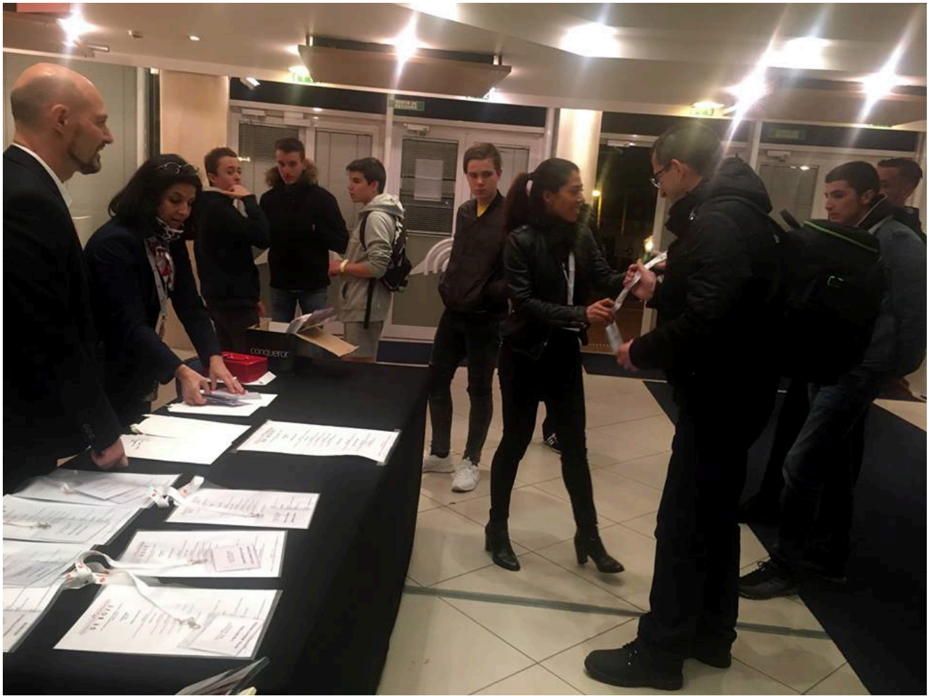
WSPORT-SHATOY получает аккредитацию на турнир