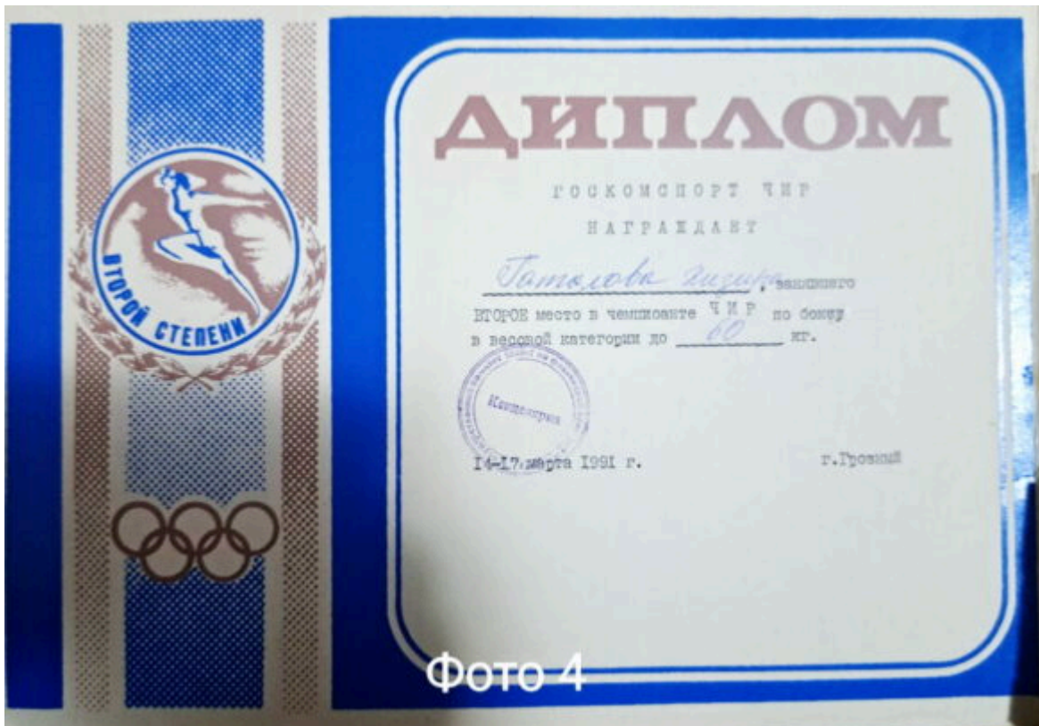
Диплом за 2 место в чемпионате ЧИР-1991