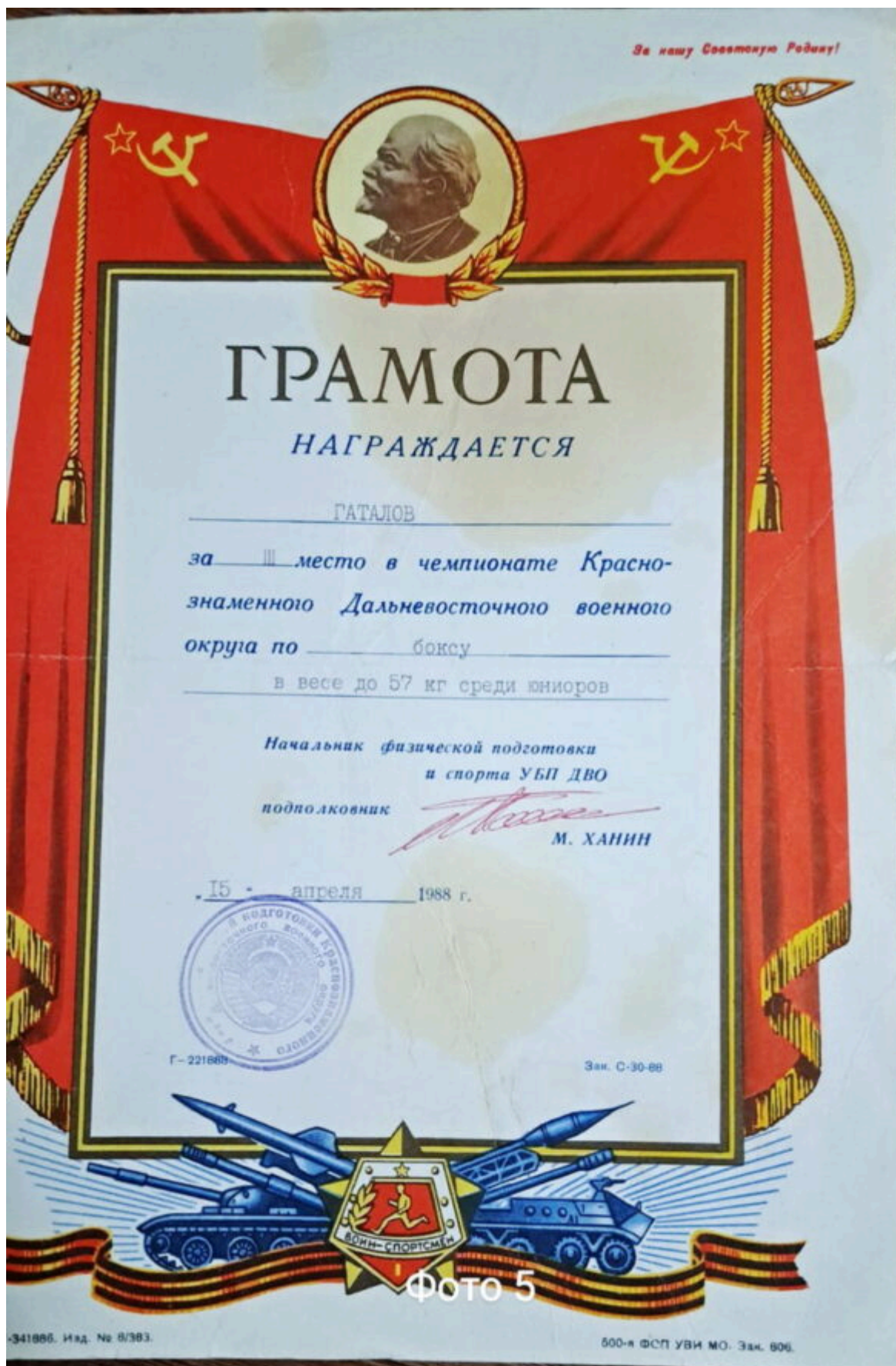
Диплом за 3 место в первенстве ДВО-1988.