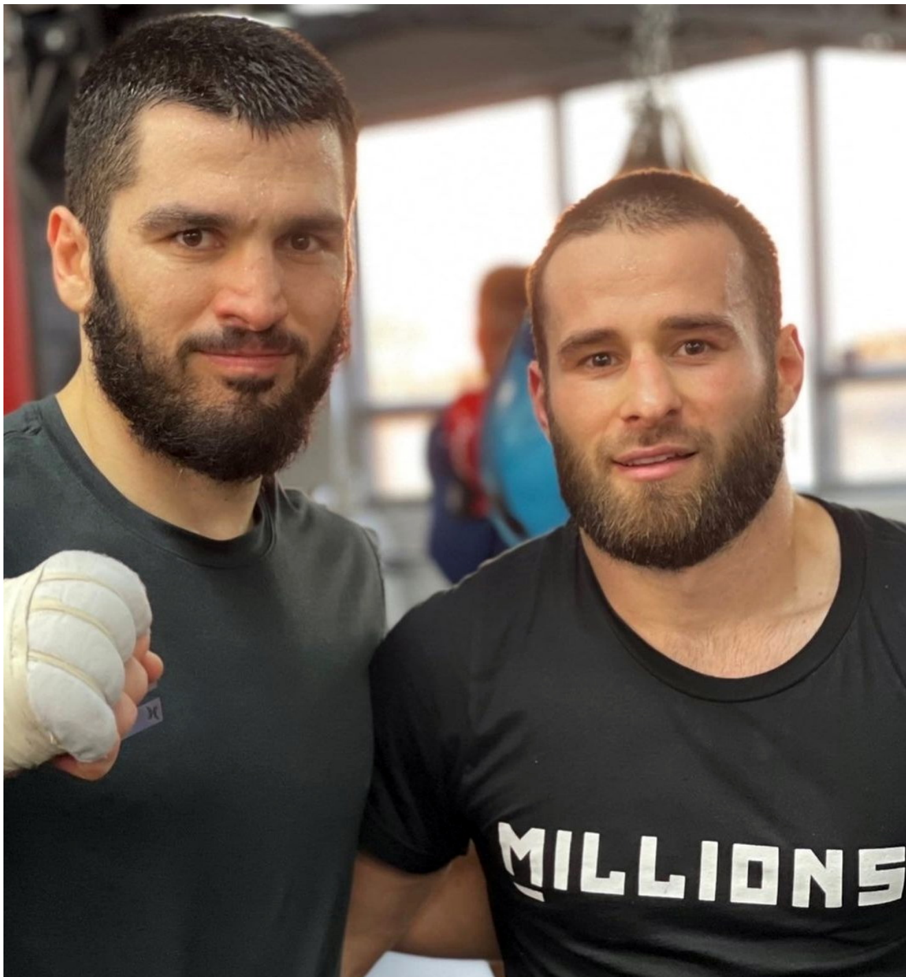
Артур Бетербиев и Артур Биярсланов