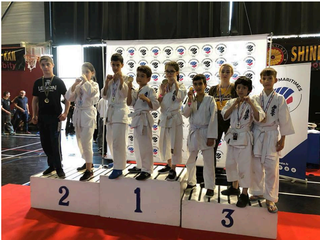
Команда каратистов клуба "Легион".