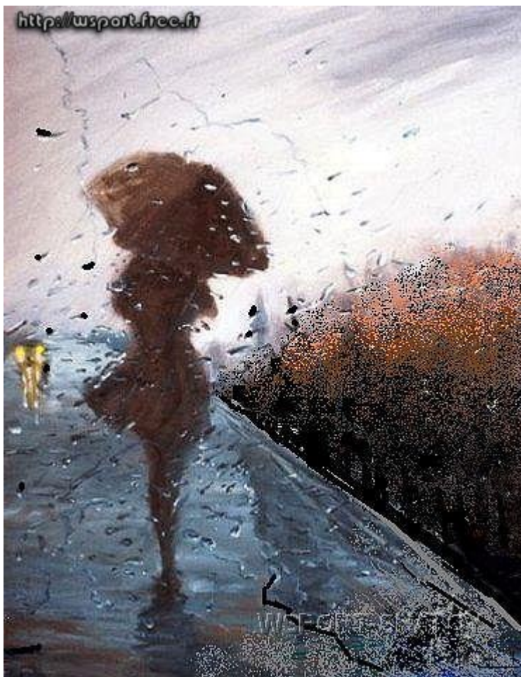
"Одиночество". Рисунок С.Долтабаева.