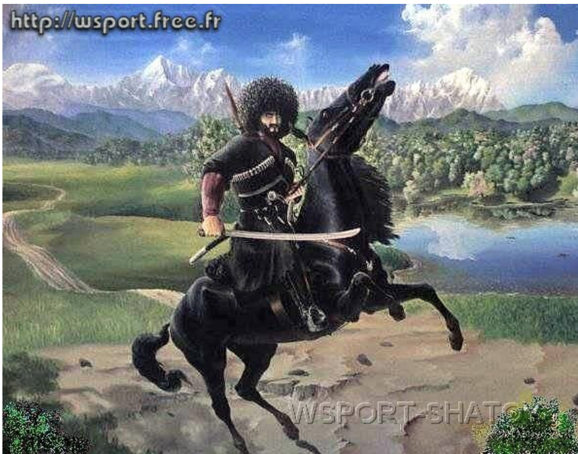
"Нохчо". Рисунок С.Долтабаева.