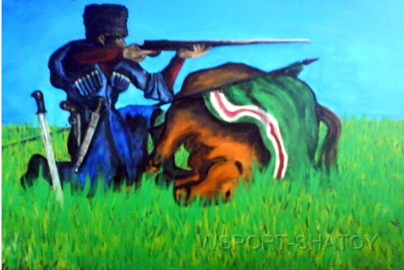
"Стрелок". Рисунок С.Долтабаева.