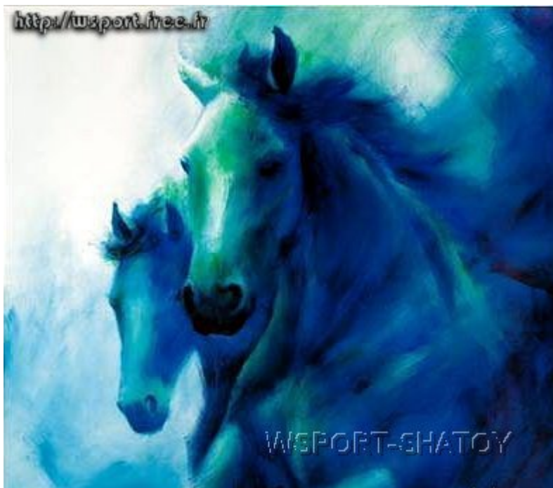
"Кони". Рисунок С.Долтабаева.