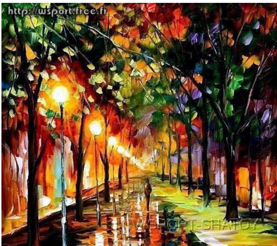
"Аллея". Рисунок С.Долтабаева.