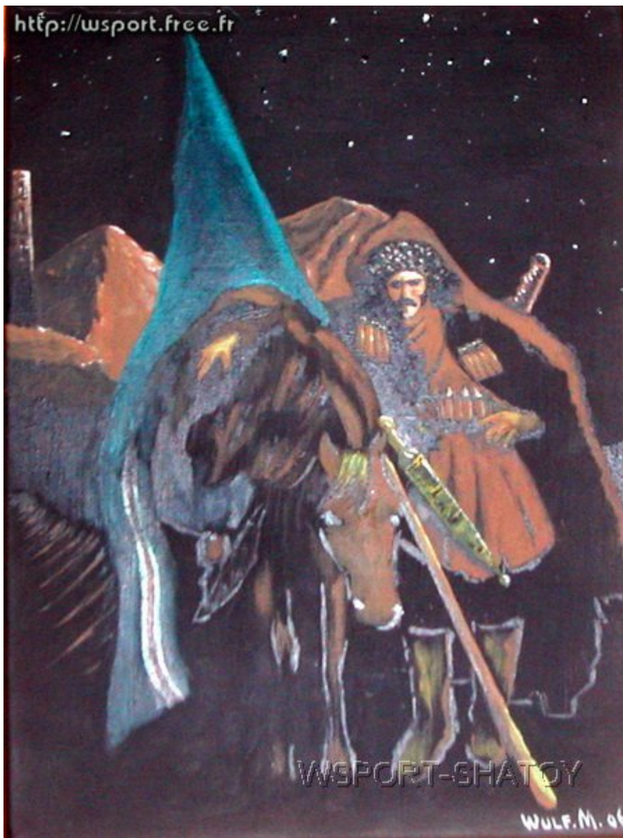
"Нохчо". Рисунок С.Долтабаева.