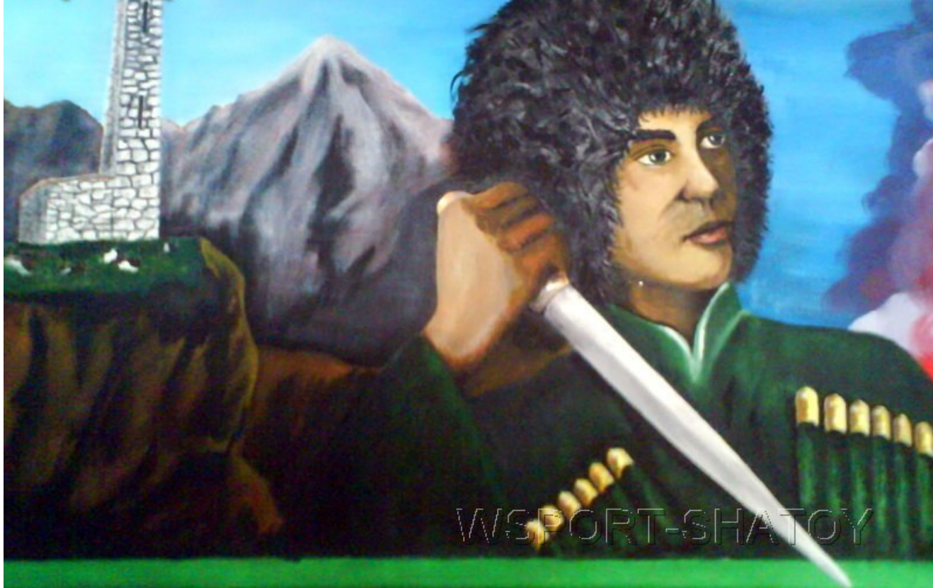
"С кинжалом". Рисунок С.Долтабаева.