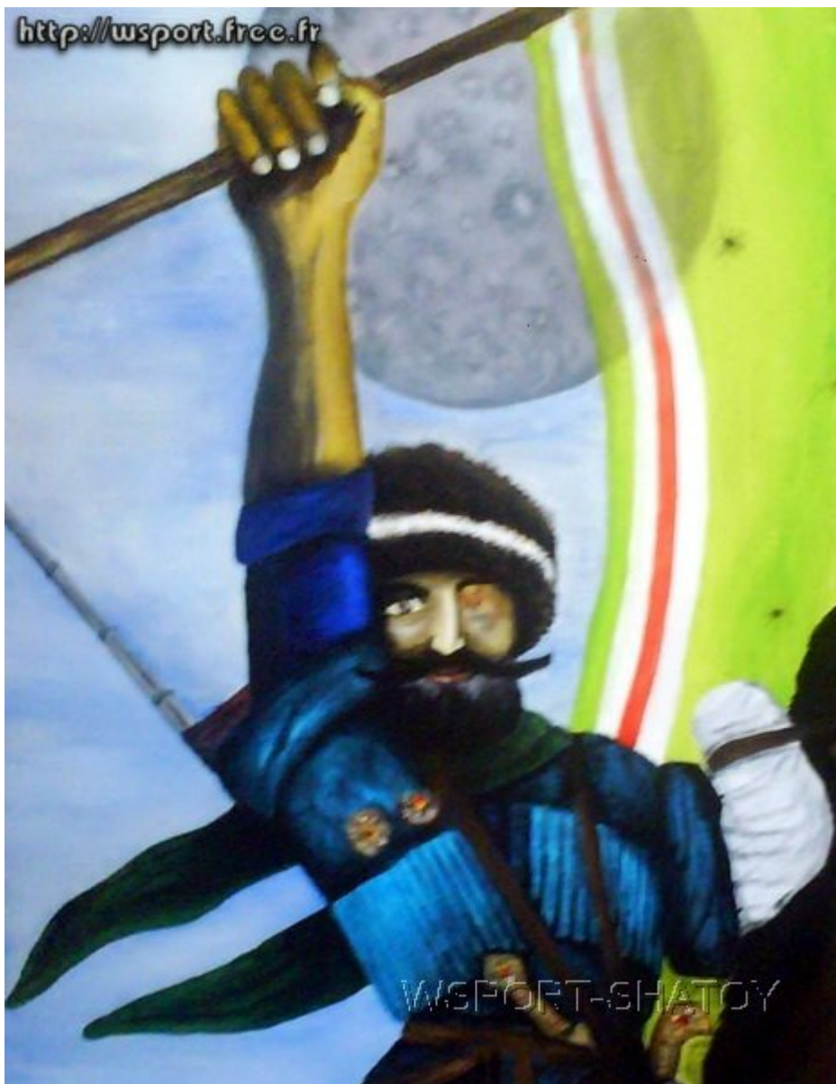
"Мой Байсангур". Рисунок С.Долтабаева.