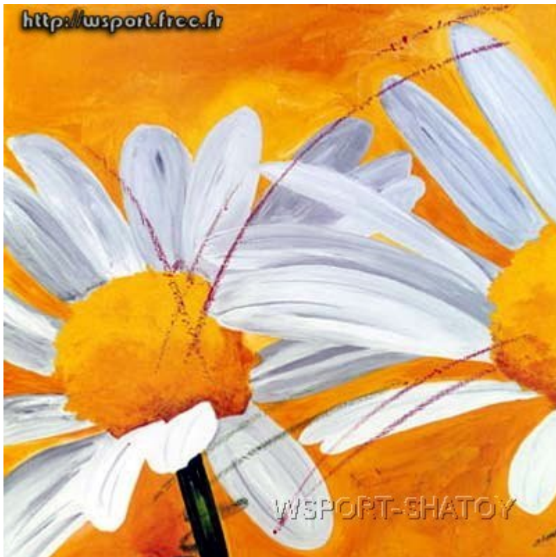
"Ромашки". Рисунок С.Долтабаева.