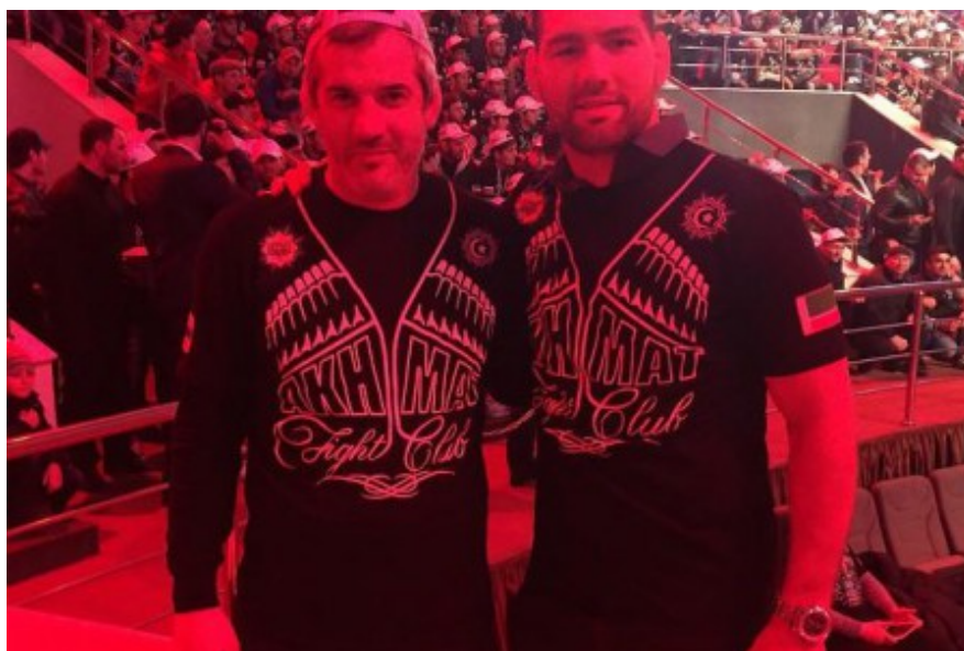
Бувайсар Сайтиев и Крис Вайдман

В спорткомплексе «Колизей» в Грозном завершился международный турнир по смешанным единоборствам «Грозная битва». В нем выступили бойцы из России, США, Франции, и других стран мира. В 14 поединках из 17 выступали чеченские спортсмены. Гостями турнира были 3-кратный олимпийский чемпион Бувайсар Сайтиев, один из лучших бойцов смешанного стиля в тяжелом весе и бывший чемпион UFC в тяжелом весе Фрэнк Мир, непобежденный боец смешанных боевых искусств в UFC в среднем весе Крис Вайдман и другие.