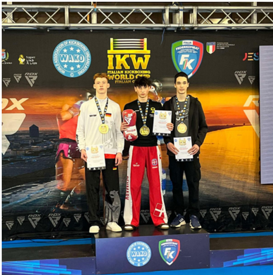
Победитель Кубка мира Зубайр Абубакаров (Дания)