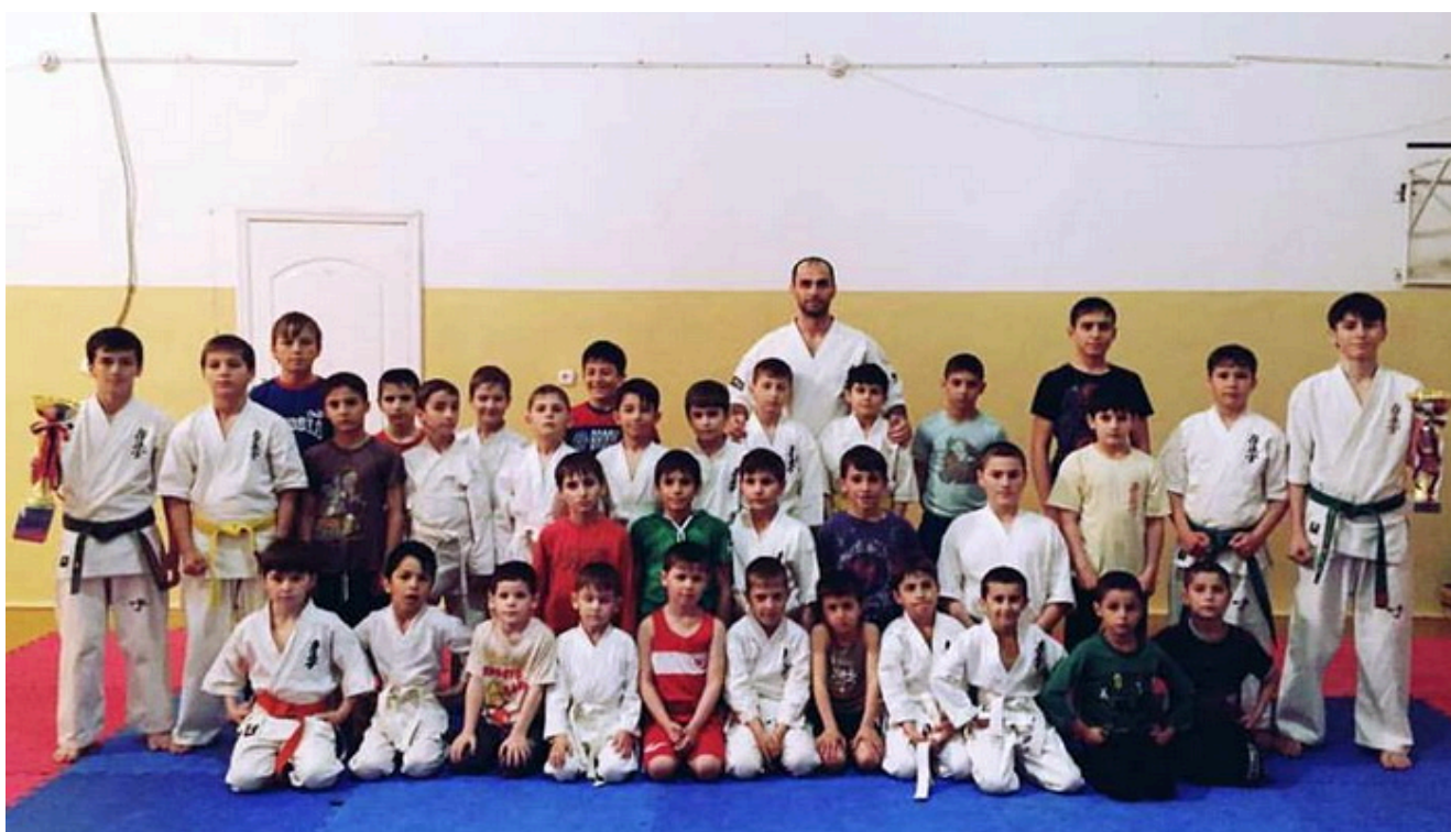
В родном Нойбере встретили чемпионов России