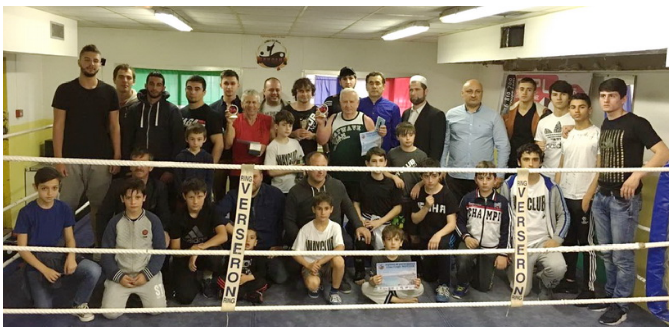
Участники и зрители 2-го Кубка Вайклуба после соревнований

Видео смотрите на Youtube канале Wayclub.