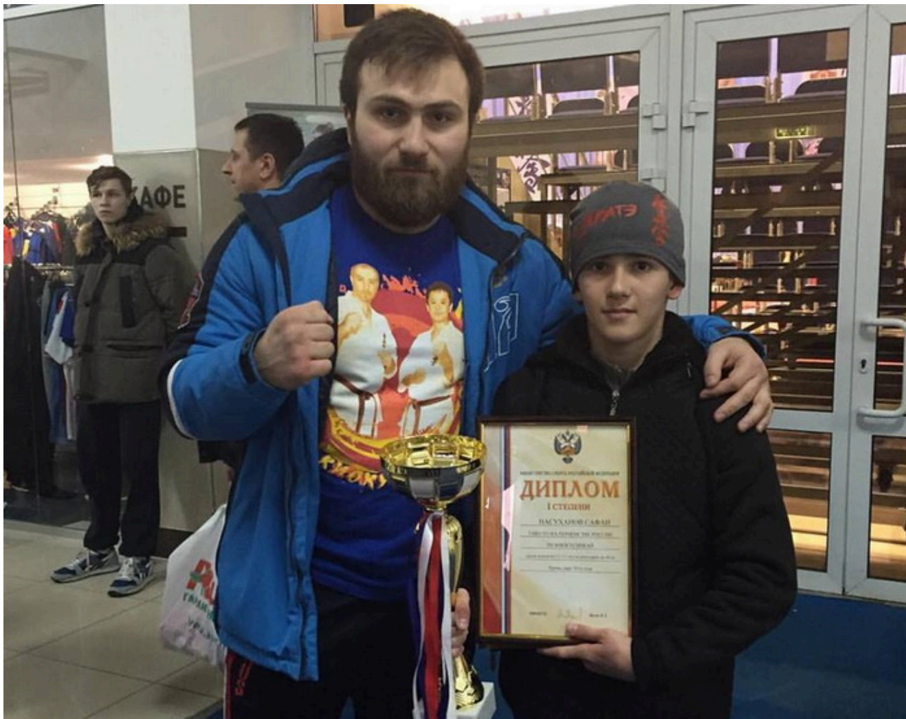
Сафаи Насуханов с абсолютным чемпионом мира Тариэлом Николеишвили