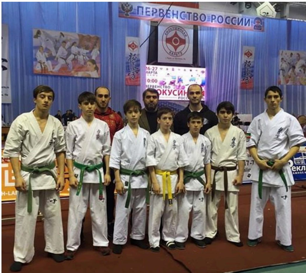
Команда Чеченской Республики в Перми