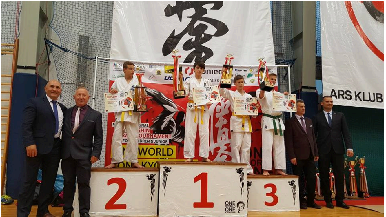
Победитель турнира в Польше Муслим Шаипов