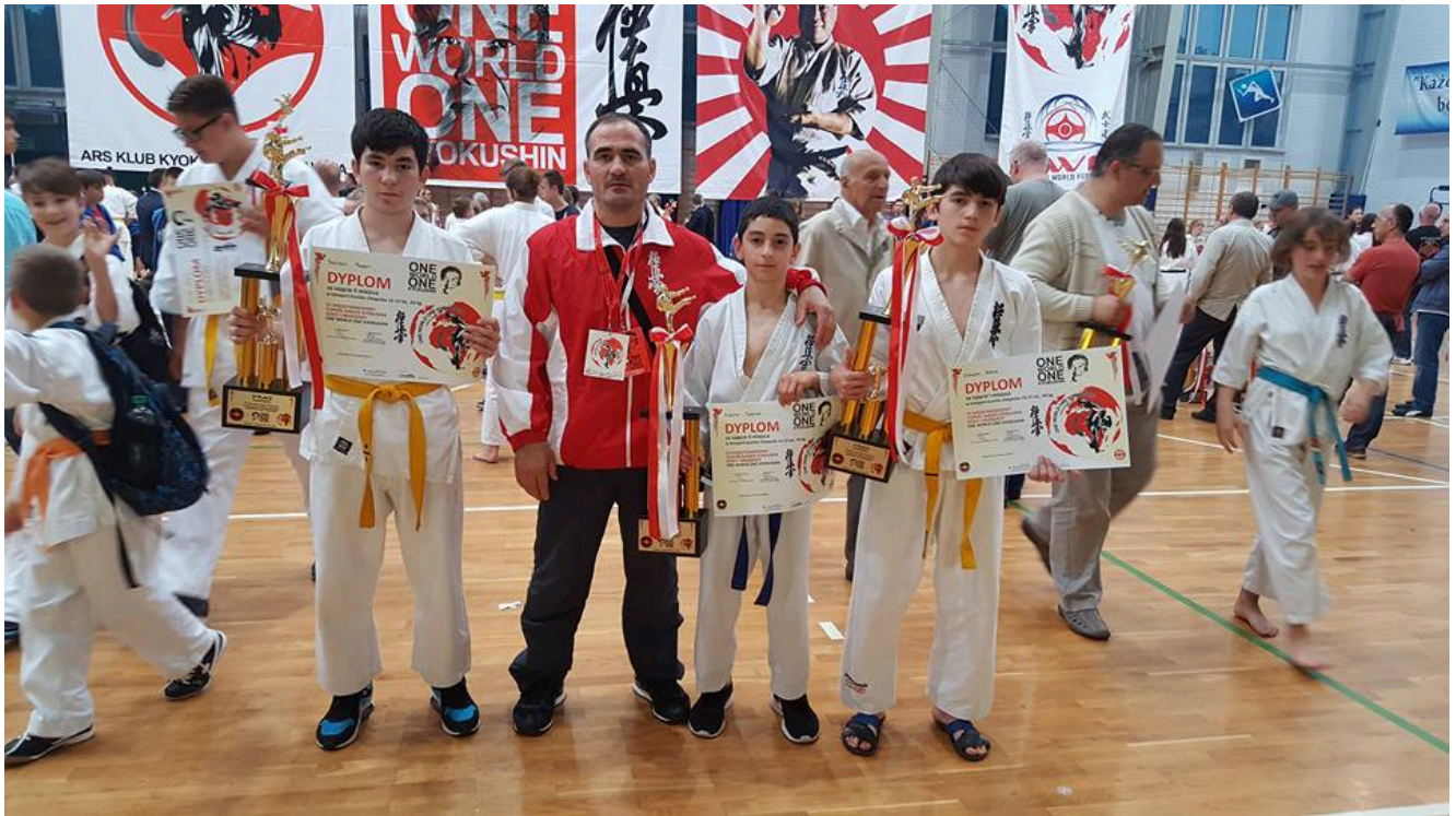
Команда клуба "Кемпо" на турнире в Польше