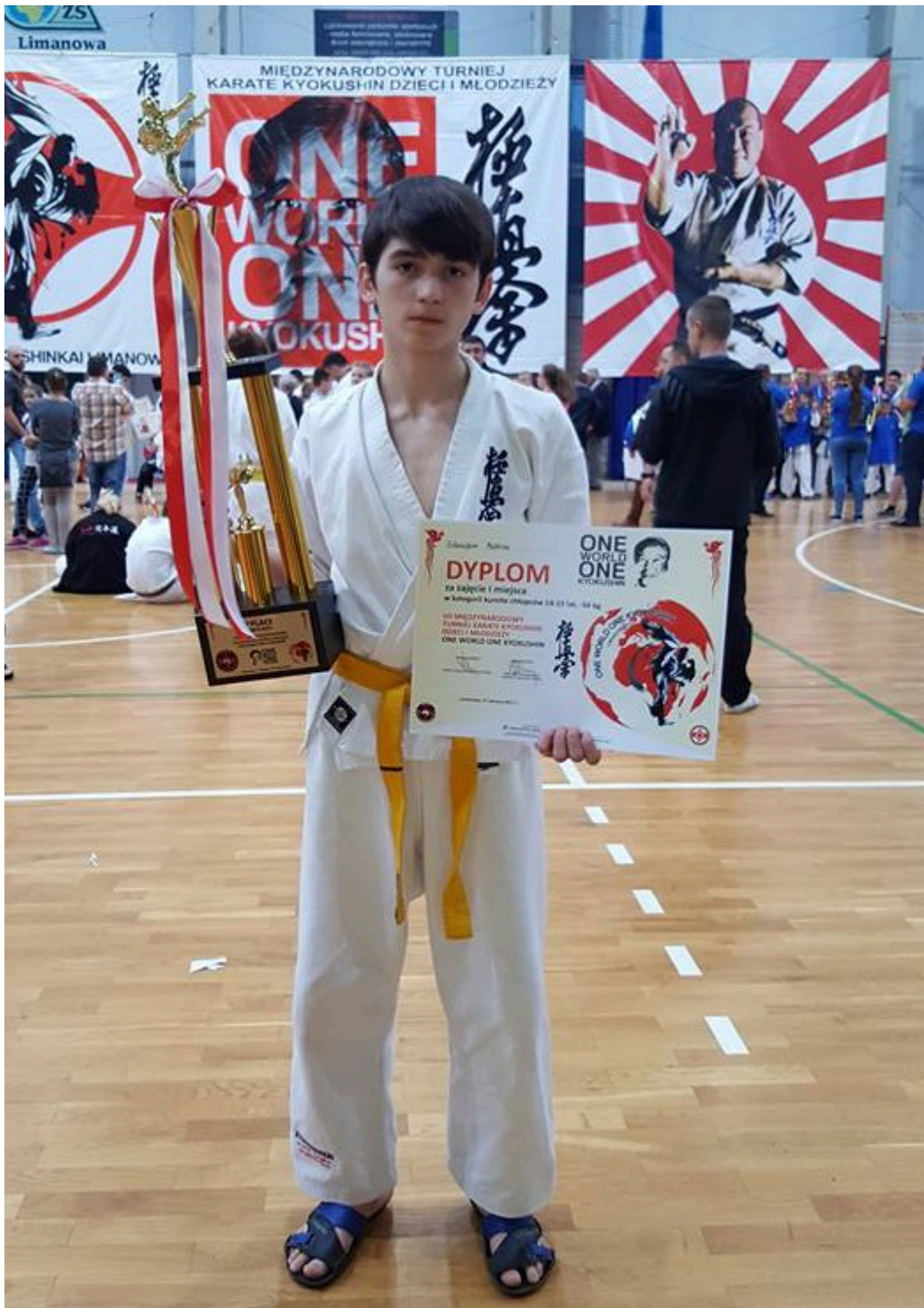
Победитель турнира в Польше Муслим Шаипов