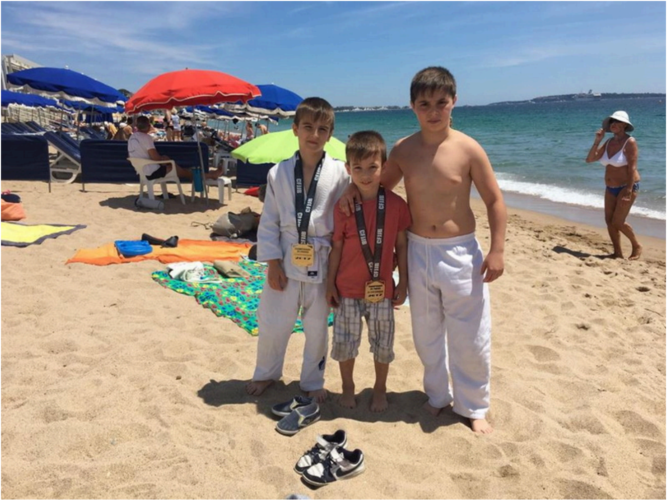
После победы - на пляж