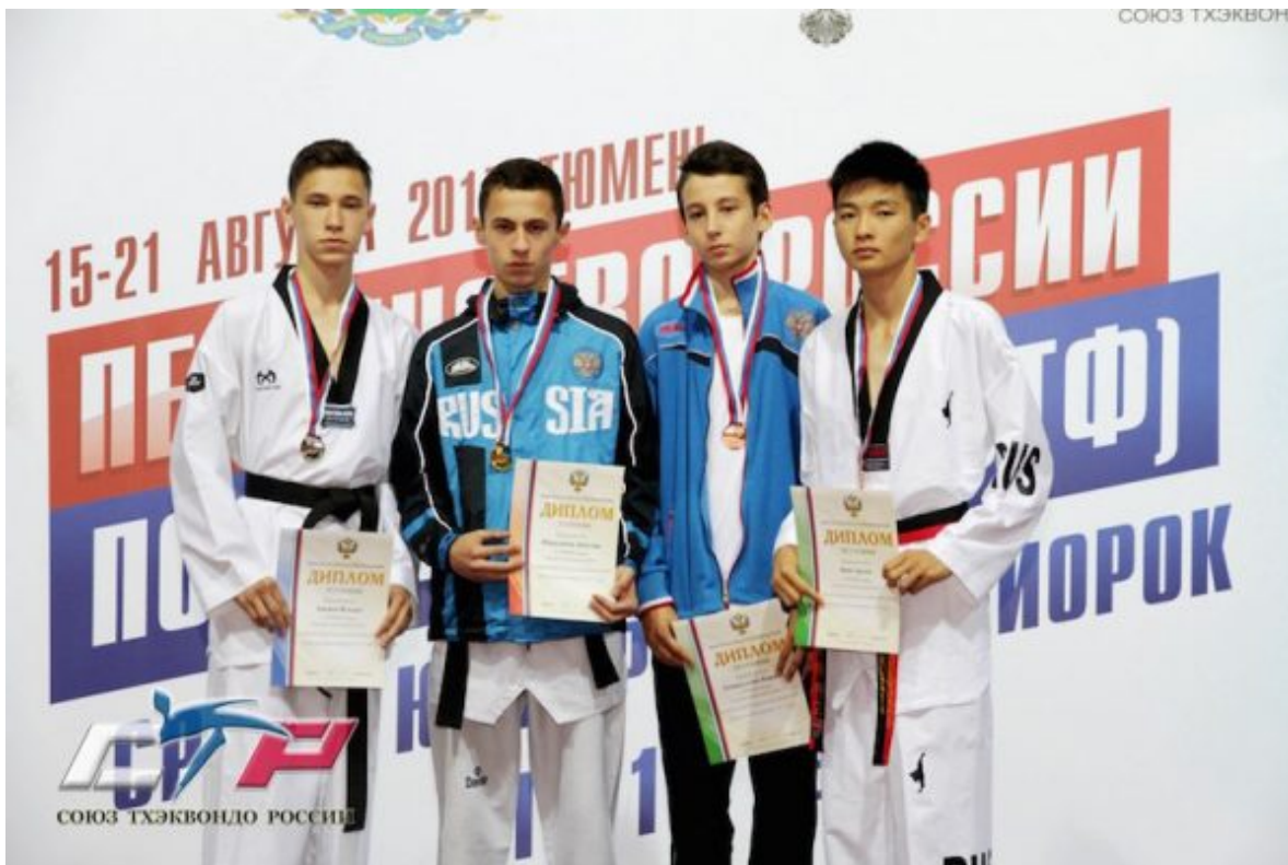
Чемпион России по тхэквондо ВТФ Зияудин Ибрагимов