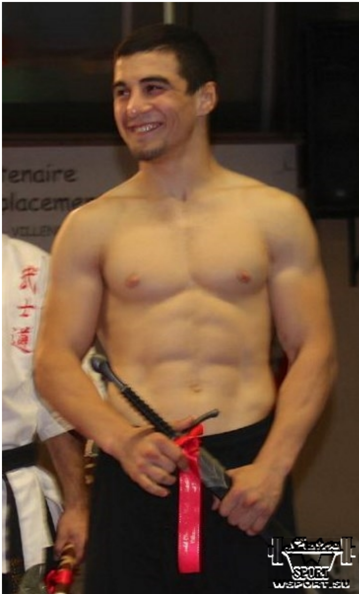
С "Мечом Воина"