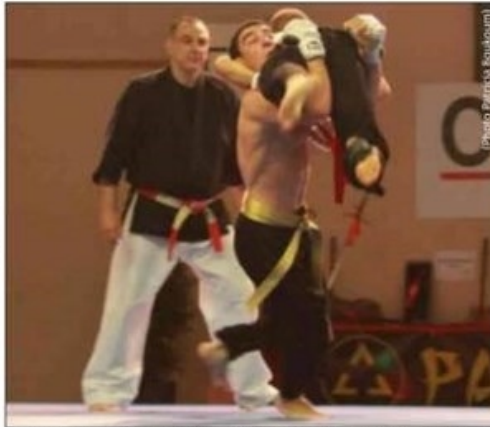
De la ferveur avec 450 spectateurs présents, samedi soir, les « World Challenge Modern Martial Arts » ont été d'une grande intensité.