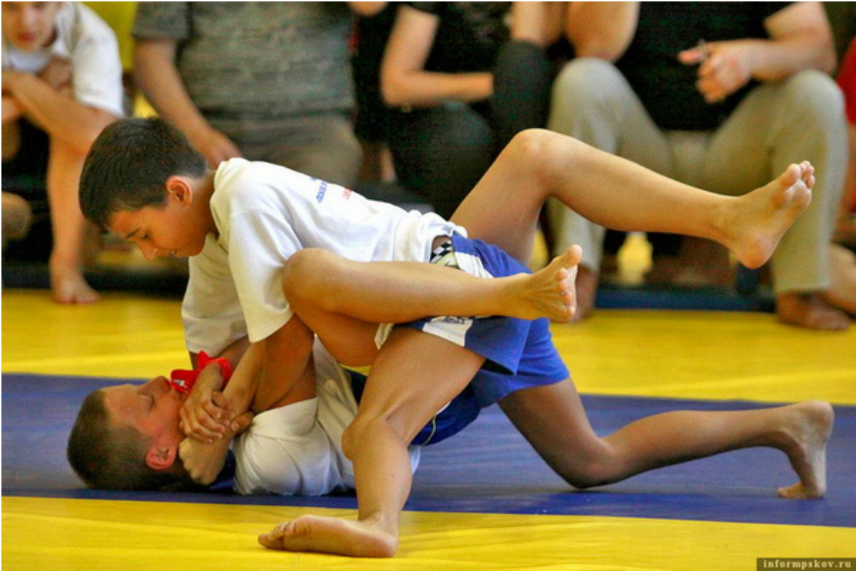
Турнир ММА в Пскове