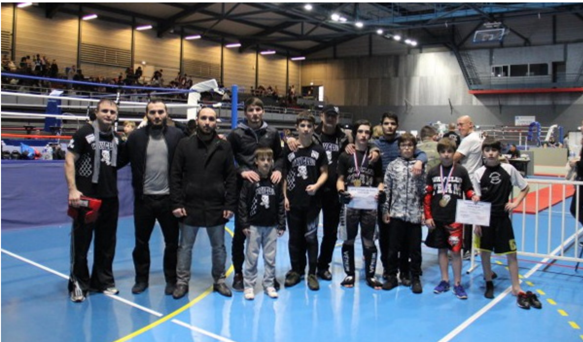
Команда Wayclub в Марселе 17.12.2017г.